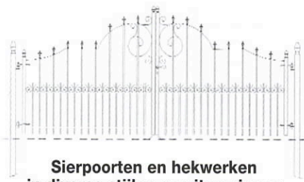
Sierpoorten en hekwerken in diverse stijlen en uitvoeringen

Postbus 566 1620 AN Hoorn Dampden 10 Hoorn Telefoon (0229) 25 87 58 Fax (0229) 23 87 68 E-mail metaal@opmaatwf.nl