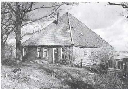
Assendelft. Deze in verval geraakte stolp, sober en van goede verhoudingen, werd gesloopt om plaats te maken voor een draak van een landhuis met puntdakjes (zie ook onze nieuwsbrieven nr. 24 en 25).

Met de verdwijning van het agrarisch bedrijf uit de stolp is een nieuwe situatie ontstaan.