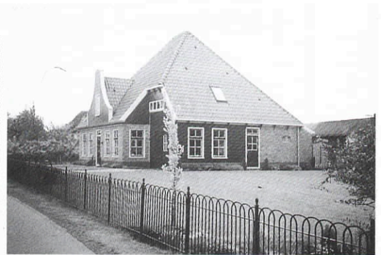
Schellinkhout. Nieuwbouwstolp in dorpsbebouwing na sloop van vervallen stolp. Met oog voor goede verhoudingen, details en kleurgebruik.

Bij nieuwbouw en herbouw in de bestaande bouwtraditie zijn het deze kenmerken die (voor alle bestemmingen) nog doen spreken van een stolp.