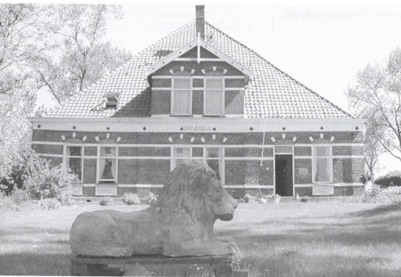
De stolpboerderij Leeuwendaal in de Purmer: met Boerenkamer.

1 april - 1 oktober (hoogseizoen): f 79,34 (€ 36,-) per nacht 1 oktober - 1 april (laagseizoen): f 72,72 (€ 33,-) per nacht