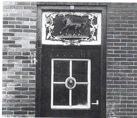
Rechts het mooie, oorspronkelijke voegwerk. Links is het voegwerk redelijk maar vertonen de stenen nogal wat kleurverschil en zijn niet goed schoongemaakt.