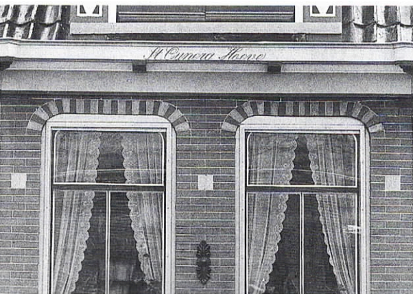
Fraaie gevel met gaaf metsel- en voegwerk, Benningbroek, rond 1900.

Vernieuwen van gevels komt bij boerderijen vaak voor; vanwege de restauratie van de boerderij of als een andere gevel-indeling met ramen en deuren wordt gerealiseerd. De keuze van de soort en kleur van de steen is daarbij vanzelfsprekend een belangrijk gegeven. Net zo belangrijk, maar toch vaak een onderdeel dat minder de aandacht krijgt, is het voegwerk. Het aanzien van een muur met fraaie stenen kan door ondeugdelijk voegwerk geheel verpest worden.