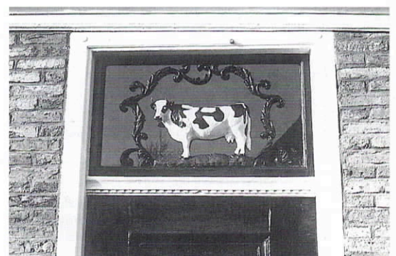
Slecht voorbeeld. De stenen zijn niet goed schoongemaakt en de laagverdeling per meter is te grof. Het voegwerk is daardoor te grof, zonder knip- en snijwerk (in de deur een mooi bovenlicht).