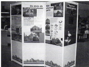
Deel van de nieuwe tentoonstelling