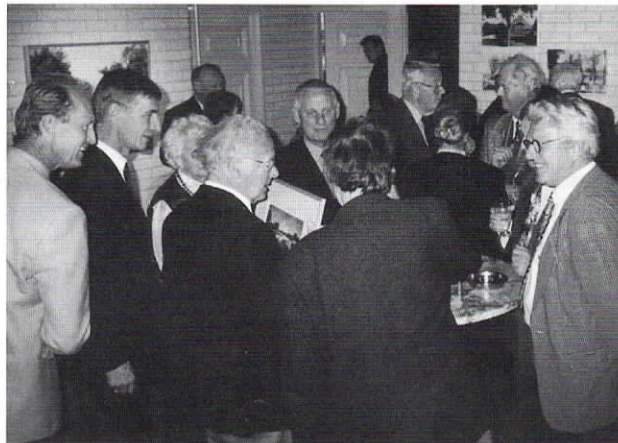
Op de receptie Anjerfondsprijs in Wittenburg, Schermer, oktober 1997