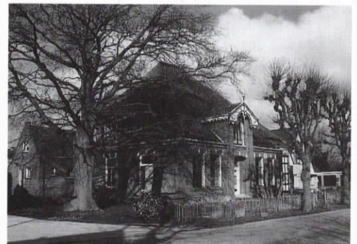
Beeldbepalende stolp gesloopt. Een groot verlies voor het dorpshart van Wijdenes (zie Stolpen in het nieuws).

Wij bereiden nu twee dag-excursies voor in groepsverband; per keer maximaal 20 personen om per busje een vijftal stolpen te bezichtigen. Kosten voor deelname: f 40,- à f 50,- p.p. (excl. lunch). Wij streven naar twee excursies op zaterdag in 1998: één in februari en één in oktober/november. Half januari is het programma van de eerste excursie rond. Opgave is alleen nog mogelijk voor de tweede excursie; deelnamemogelijkheid in volgorde van binnenkomst van aanmelding (opgeven: schriftelijk aan het secretariaat).