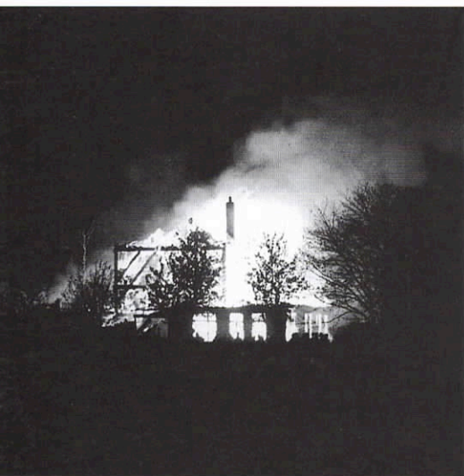
Schrikbeeld voor de boerderijbewoner.

Schrikbeeld voor bewoners van stolpboerderijen: brand. Door onweer of kortsluiting, hooibroei of soms een onbenuilige aanleiding als vlam in de pan of wat gemorste brandstof. Ook brand die van nabij gelegen, in brand staande panden overslaat bij een ongelukkige windrichting. Tientallen boerderijen zijn de laatste jaren door verterend vuur verloren gegaan. Voor de brandweer soms onmogelijk te blussen. Vooral als het gaat om met riet gedekte boerderijen; als de melding (te) laat is of de boerderij afgelegen ligt. Het is dit onderwerp: brand; het voorkomen ervan en de brandverzekering die centraal staan in deze nieuwsbrief. Recentelijk sloeg de rode haan weer toe in stolpenland. In Bergen werden drie boerderijen in een korte tijdsspanne door brand getroffen. Maar gelukkig ook behouden door het kordaat optredende brandweerkorps van deze Noordkennemerse gemeente. Voor onze Boerderijstichting de reden om aan dit korps de Stolp-Award uit te reiken. Met daarbij de waardering ook voor brandweerkorpsen in andere plaatsen die onder vaak moeilijke