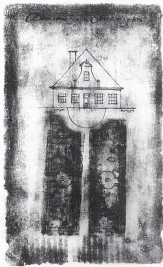
De Stolp-Award 1996.

Medio 1993 presenteerde de werkgroep een complete inventarisatie van onder andere alle karakteristieke stolpen in de gemeente. 'Monumentaal Heerhugowaard' is een werkstuk van formaat, dat in Noord-Holland beslist navolging verdient. De werkgroep is mede hierdoor uitgegroeid tot een volwaardige gesprekspartner van de gemeente, die gehoor gaf aan de oproep voor een algemeen voorzichtigheidsbeleid voor stolpen. Ook particulieren weten voor een deskundig advies de werkgroep te vinden.