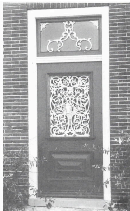
Binnenwijzend nr. 40

Langs Binnenwijzend dat in 1911 9 boerderijen en de kerk bij een grote brand verloor (waarna herbouw is gevolgd) komt de route in Hoogkarspel. De streekweg hier vormt de verbinding tussen Hoorn en Enkhuzen en stamt uit 1669.