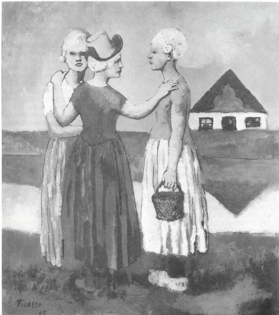
Picasso verbleef in 1905 in Schoorldam: Les Trois Hollandaises.

Oordeel ook zelf. Ga deze zomer als vriend en vriendin van de stolp het Noordhollands landschap in. Er is veel te zien en te doen.