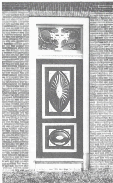
Oosterblokker nr. 39

In Oosterblokker is de stolp op nr. 39 een der fraaiste van deze route. In het rieten dak en op de (nieuwe) ronde schoorsteen is het jaartal 1836 vermeld. Westfries herenboerderijtype met tophalsgevel waarop bekroning met siervazen en fraaie staatsie deur.