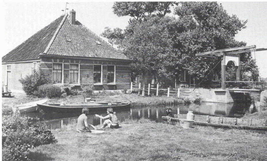
De Woude, eiland in het Alkmaardermeer.

Vrienden van de stolp, woonachtig in Waterland: het adres van het Recreatieschap Waterland, voor meer informatie: Beheersbureau, de Erven 2, 1151 AS Broek-in-Waterland.