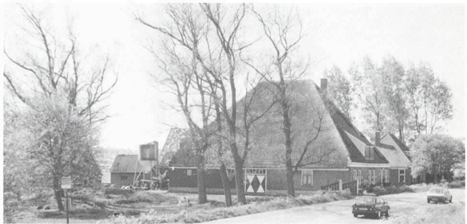
Butterhuizen, Heerhugowaard, Westerveg 4. Gesloopt in 1992.