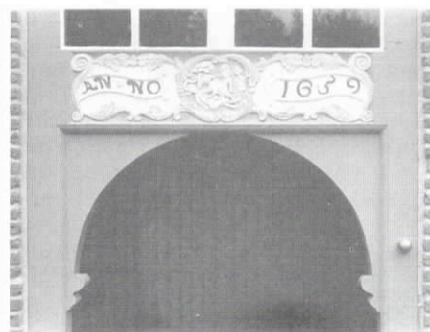
Westerblokker. De Barmhartige Samaritaan.