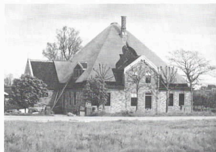
De 'Maria Hoeve', de Hulk, Scharwoude.

De ingestelde 'Stolp-Award' kan er op bescheiden wijze een stimulans bij zijn. De bedoeling is in november a.s. een tweede serie uit te reiken.