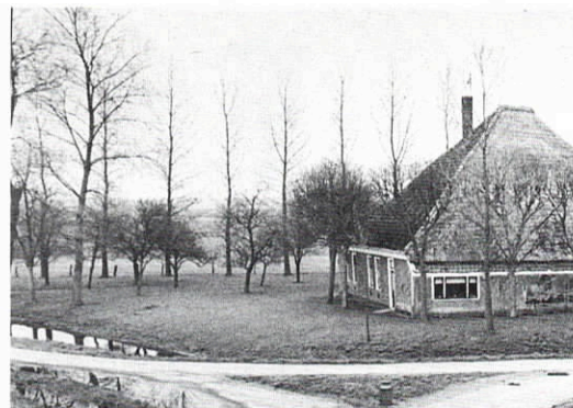
Boerderijmonument, Noord Schermerdijk, Schermer. Foto

Broek-in-Waterland, Den Hoorn (gem. Texel), De Rijk, Egmond aan den Hoef, Enkhuizen, Haaldersbroek (gem. Zaanstad), Holysloot (gem. Amsterdam), Kolhorn (gem. Niedorp), Medemblik, Midden-Beemster, Monnickendam, Oosterend (gem. Texel), Ransdorp (gem. Amsterdam), Spaarndam (Haarlemmerliede), Twisk, Westzaan (gem. Zaanstad) en Zuidwoude (gem. Broek-in-Waterland). Na aanwijzing van een beschermd gezicht door de minister van WVC, is