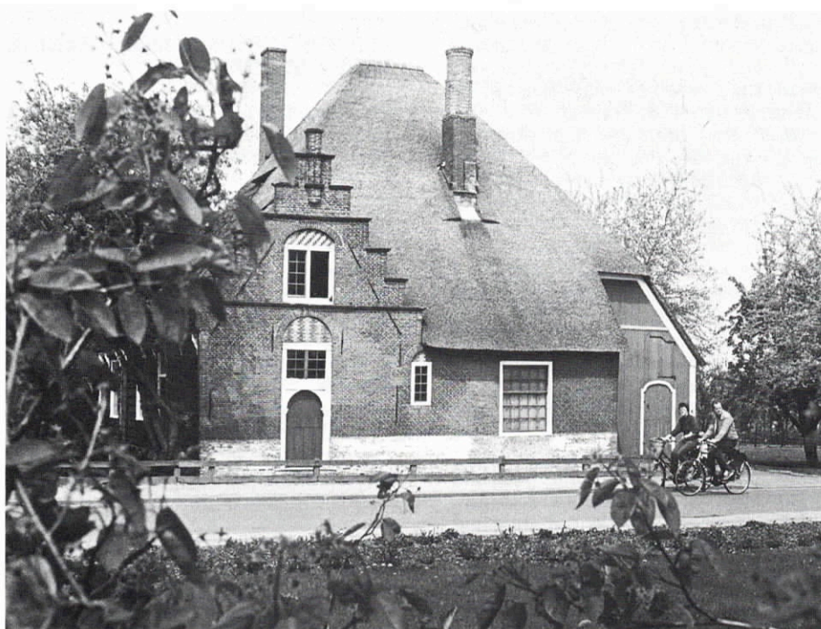
'De barmhartige Samaritaan', Blokker; thans in restauratie.

Als de gemeente een eigen monumentenverordening en monumentencommissie heeft, kan die zelf over de vergunning beslissen. Zo niet, dan wordt de vergunning door de minister