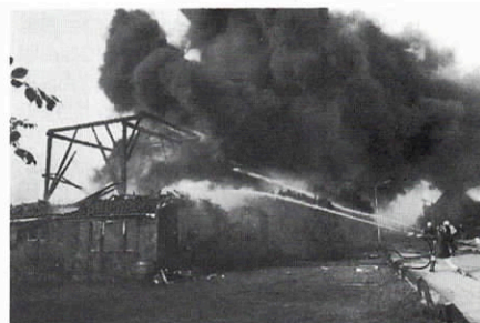
Brand velt stolp in Blokker.

Het betekent een verandering en vooral een verarming van dorpsbeeld en landschap. Een verlies aan monumentaal erfgoed en identiteit dat zich over een tijdsspanne van enkele decennia indringend openbaart. Immers: herbouw op de plaats van de gesloopte of verbrande stolp levert in veruit de meeste gevallen een bouwwerk op van een geheel ander aanzien. Onze stichting bepleit in de contacten met provincie en gemeenten voorwaarden te scheppen om bij herbouw te kunnen bewaken dat de hoofdvorm een beeld oplevert dat zoveel mogelijk recht doet aan wat verloren ging.