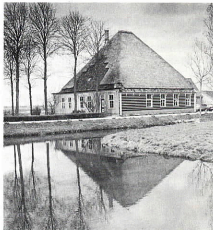
Gerestaureerde stolp, Bobeldijk.