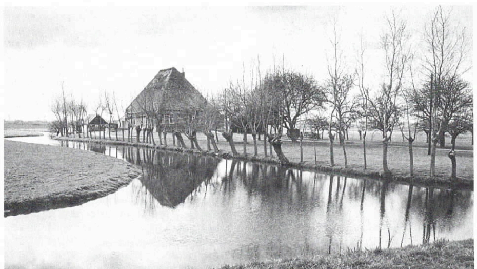
Boerderij-erv Leekermear, Wognum.

Soms werden de stroken beplant met rijen bomen waar in veel gevallen de iep voor gekozen werd, wat steeds vaker voorkwam in verband met verlies aan de gebruikswaarde van het 'geriefhout' en de meer in zwing rakende verfraaiingsfunctie van de beplantingen. Op veel erven van de nu nog aanwezige stolpboerderijen kunnen we soms nog een of andere vorm van deze 'laening' terugvinden.