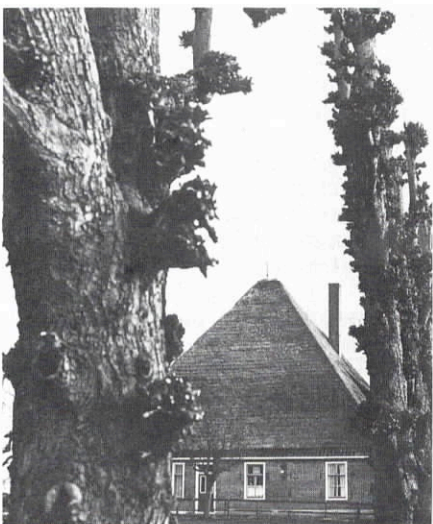
Geknotte bomen rond stolp, Schellinkhout.

de van de boerderijen vaak meer als sierboom aangeplante bomen als b.v. bruine beuk, linde, paardekastanje e.d. Dominant in het grote groene grasveld, dat vrijwel het gehele erf besloeg. Want het ontbreken van een bloementuin was karakteristiek voor het Noordhollandse boerenerf. Wel tref je er struikgroepen of sierheesters aan (b.v. hortensia, ribes, hulst). Daarentegen bloeiden in het voorjaar op de erven zeer uitbundig de sneeuwkllokjes, de crocussen en op sommige plaatsen de helder gele winteraconiet. Maar in de rest van het jaar had het boerenerf een sfeer van soberheid, eenvoud en rust, gemarkeerd door majestueuze bomen.