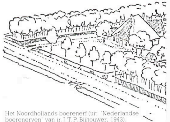
Het Noordhollands boerenerv (uit: 'Nederlandse boerenerven' van ir. J. T. P. Bijhouwer, 1943).

Zoals al opgemerkt werd de keuze van de beplantingen qua vorm en soort ingegeven door de functies die ze moesten vervullen. De brede stroken, tussen de sloten, die de buitenste omgrenzing van het erf markeerden, werden beplant met bomen in de vorm van windsingel of laanbeplanting. Vaak spreekt men dan ook over de 'laening'. Dit werd voor een gedeelte ingegeven door het feit dat veel stolpboerderijen in de 17e eeuw gesticht werden door de kooplieden uit de grote steden, die het voorbeeld