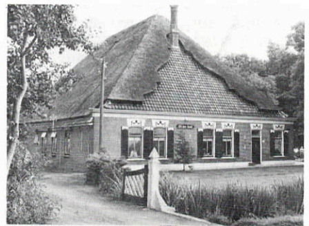
Stolpboerderij 'Uit den Haak', Schagerbrug.

De Boerderijstichtingen zijn op 19 mei en op 25 november j.l. bijeen geweest. Een goede voorlichting naar overheid en particulieren is een gemeenschappelijk doel; de verwachting is dat ongeveer een derde van het huidige boerderijenbestand van functie zal veranderen.