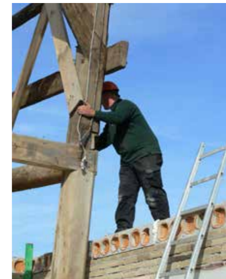
De constructie wordt gesteld.