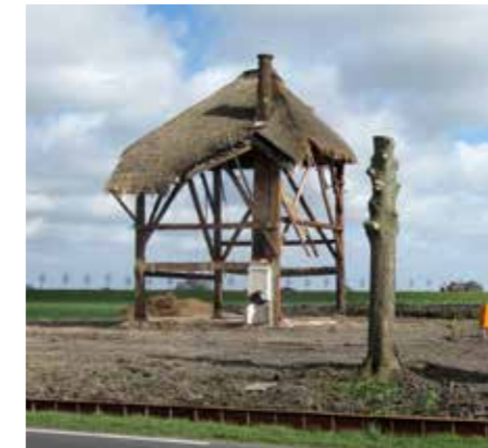
MAART. Beemster. Hoeve Bamestra onttakeld.