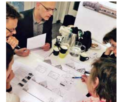
SEPTEMBER. Alkmaar. Cursusavond Stolp bij WZNH.