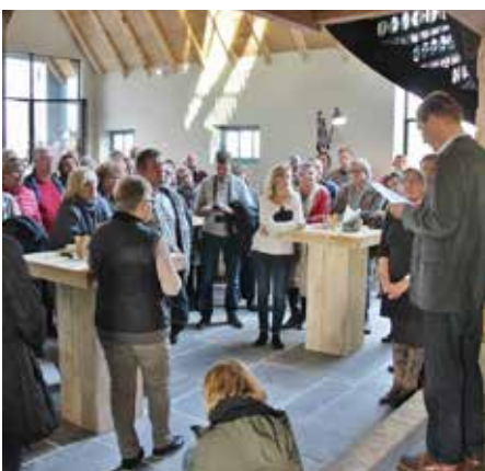
Uitreiking Stolp Award in de Bommelhoeve, Bergen.