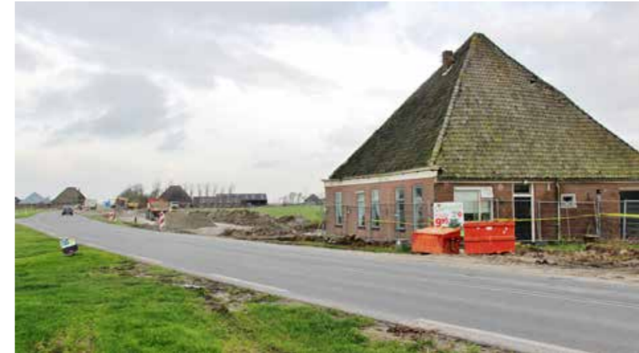
Deze stolp wordt gesloopt en ook die met stolpschuur links op deze foto.

De stolp met dubbel vierkant, aangebouwde kleine stolpschuur en verschillende schuren en schuurtjes aan de Provincialeweg 5 bij Zijdewind staat model voor nog drie andere stolpboerderijen die in dezelfde (deplorabele) toestand verkeren. De dichtgetimmerde ramen, het grimmige hekwerk en het gele lint laten niets te raden over een niet al te rooskleurige nabije toekomst van deze stolp. Generaties was deze stolp het werkzame en gelukkige domein van de familie Wit, die uiteindelijk niet anders kon dan meebuigen met de plannen van de overheid om de provinciale weg in kwestie (Schagen-Zijdewind) te upgraden naar een met vrij liggende ventweg. Zoals bij de N9 het geval was. Voor zo'n infrastructureel werk is (meer) ruimte nodig en deze stolp staat in de baan van de geprojecteerde weg. De economie moet voort, daar is geen speld tussen te krijgen en dat willen wij ook niet. Alhoewel er wel degelijk archeologisch onderzoek wordt gedaan (het is hier ten slotte zeer oud land), is de prangende vraag, waar blijft de o zo belangrijk geachte cultuurhistorische waarde van de te slopen stolp. Wordt de stolp bouwhistorisch gedocumenteerd, gefotografeerd en vindt er wel dendrochronologisch onderzoek aan het vierkant plaats?