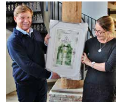
OKTOBER. Bergen. Stolp Award voor Bommelhoeve.