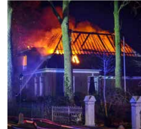
JANUARI. Berkhout. Stolpenbrand in vuurwerknacht.

Uit talloze reacties blijkt in het afgelopen jaar de waardering voor de stolp. Voor de markante vorm en het dragende beeld in het landschap. Voor de (bewoners-)geschiedenis en de stolp als woonboerderij, met zijn vele mogelijkheden en symbool van geborgenheid. Steeds minder geluiden wijzen richting sloop, hoewel er toch nog stolpen worden bedreigd met afbraak, door verregaand verval en wegehonger.