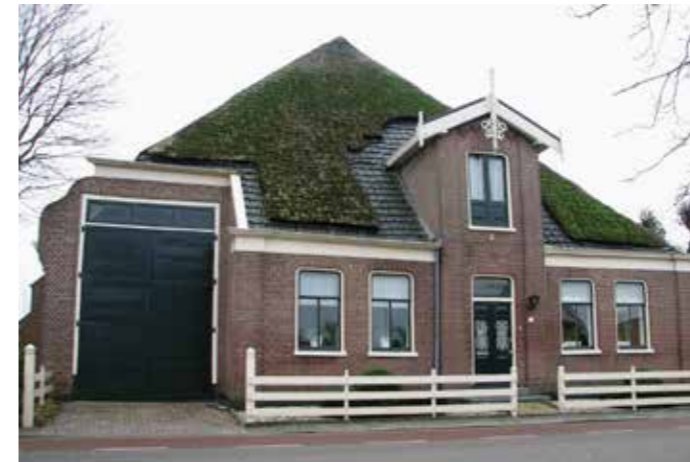
De stolp in Wervershoof, 2012.