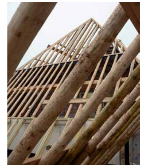
Zicht op de nieuwe dakconstructie.