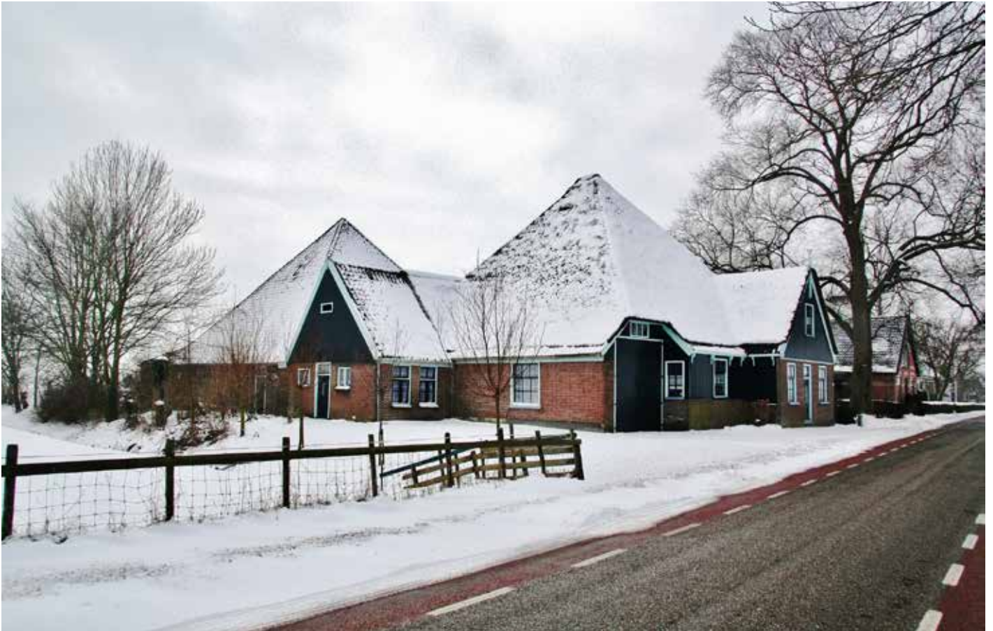
Stolpcomplex aan de Binnenwijzend, Westwoud. Fraaie eenheid van Westfriese stolp, stolpschuur en erf. En dat het hele jaar rond.