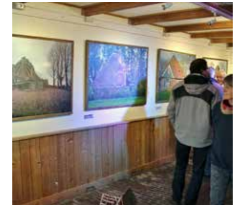
FEBRUARI. Hoorn. Tentoonstelling bedreigde stolpen.