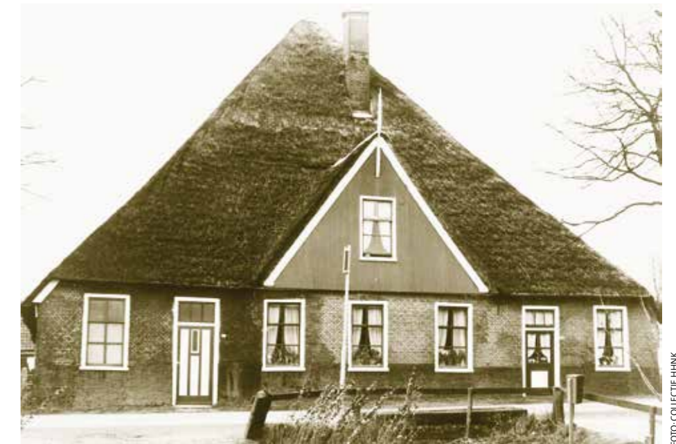
De forse, rietgedekte wie-weet-waar stolp.

De van top tot teen rietgedekte staat van het puntdak en dat van de topgevel is het eerste dat aan deze stolp opvalt, waarbij het ontbreken van dakgoten in tweede instantie onmiddellijk in het oog springt. Die zijn er helemaal niet en het riet hangt daarom ook ver over de verticale wand van de muren. Zowel voor, opzij als bij de topgevel. Het water moet immers wel degelijk goed aflopen. Het is aan deze stolpboerderij een zeer opmerkelijk detail, dat een stolpenspeurmeus wellicht op een spoor zet. Vervolgens de houten topgevel precies in het midden van de voorgevel met een helder wit en zeer puntig exemplaar van een makelaar. Feitelijk de enige sier aan de hele stolp. Verder een 'doodgewone', vierkante schoorsteen zonder jaartal of siersteen. De voorgevel is weer eens ouderwets ritmisch perfect met z'n twee deuren aan weerszijden en evenwichtige raamverdeling. Het wit van de kozijnen (en de waterborden) is bij deze