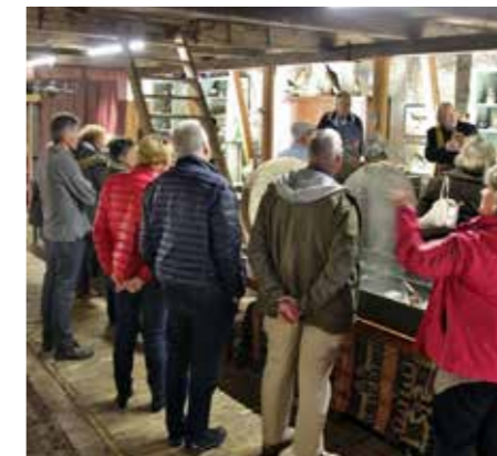
OKTOBER. Egmond+Bergen. Najaarsexcursie Vrienden.