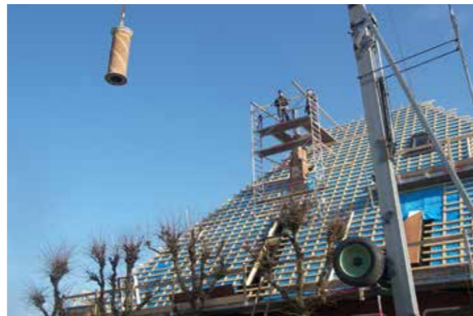
De nieuwe ronde schoorsteen komt aangevlogen.