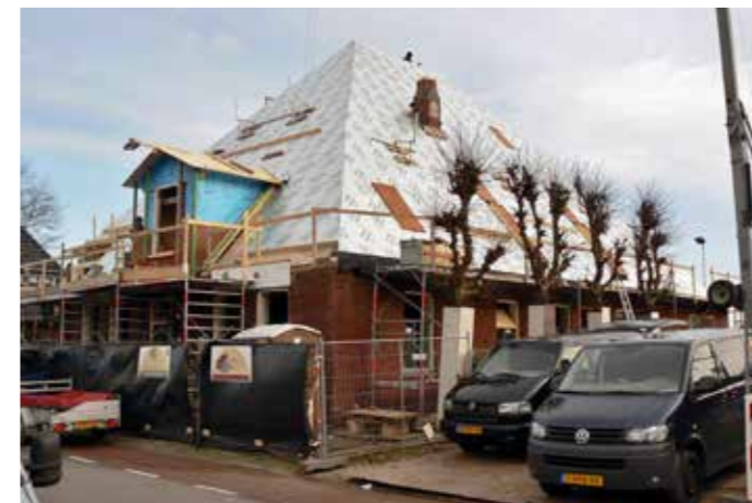
Dakisolatie wordt aangebracht.