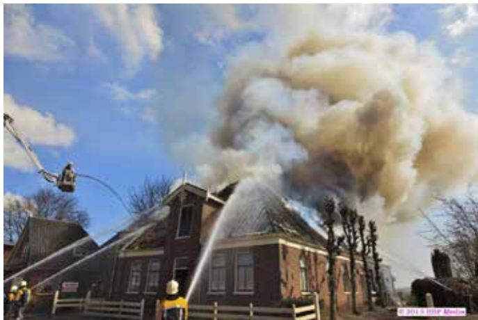
De brandweer is snel ter plaatse.

een wens tot herbouw heel begrijpbaar. Het beeldverhaal toont de brand, de restanten na het bluswerk, het geblakerde vierkant, het onderzoek naar hergebruik van de houtconstructie, het opruimen en schoonmaken, de eerste stappen naar een herbouw, de verbouwing in volle gang en de herinrichting naar een nieuwe stolpboerderij. Als een feniks uit de as herrezen is dit tevens een exemplarisch voorbeeld van hoe sterk het merk stolp in feite is. Ontdek de waarde van deze oude en slimme bouwstijl waarvan duurzaamheid in feite een ouderwets vooruitstrevende karaktertrek is. Lang leve deze zo kenmerkende houtconstructie. Een stolpboerderij gaat levens lang mee. Gegarandeerd. Deze fotoserie toont aan dat het ultieme stolpsprookje nog bestaat. Lang ... en hoe gelukkig! ▲