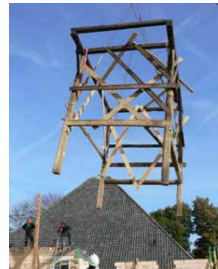
Aankomst nieuw (hergebruikt) vierkant.