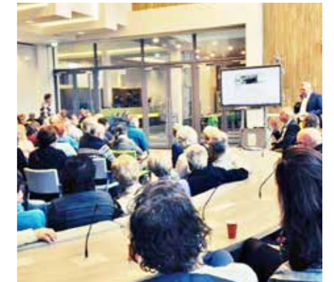
MEI. Westfriesland. Info Duurzame Stolpen.