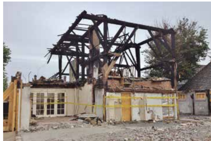
De gevels staan nog overeind, het vierkant is (te) zwaar aangetast.