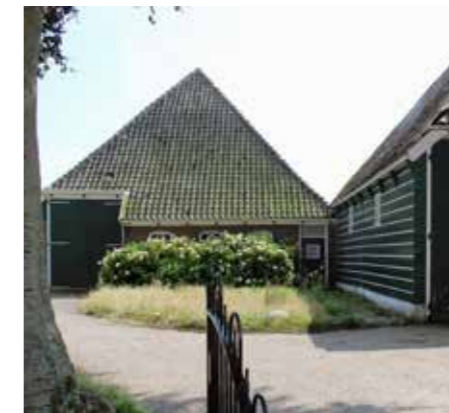
JULI. Nibbixwoud. Stolp in centrum gesloopt.