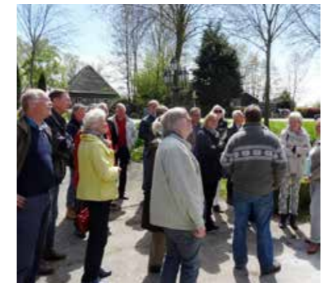
MEI. Zwaagdijk. Voorjaarsexcursie Vrienden.