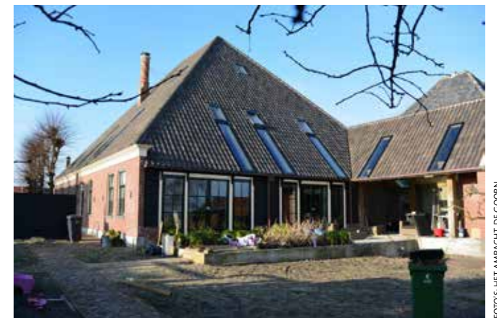
De achtergevel en zijgevels zijn nieuw ingedeeld.