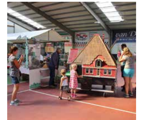
AUGUSTUS. Opmeer. Presentatie op Landbouwdag.