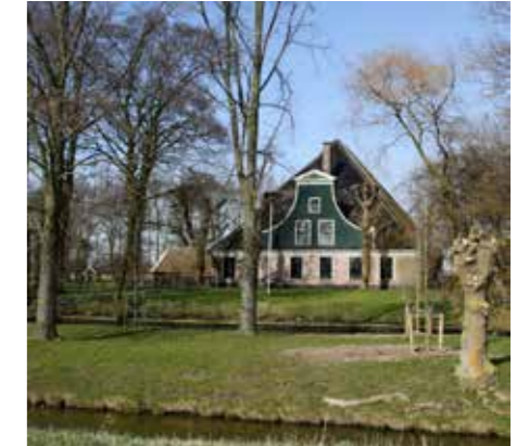
JANUARI. Alkmaar krijgt er 310 stolpen bij. Ook deze.