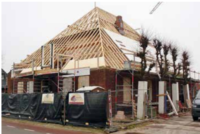
Nieuw dakconstructie naar oorspronkelijk model.