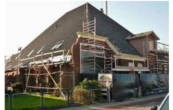
De laatste fase van herbouw in 2014.