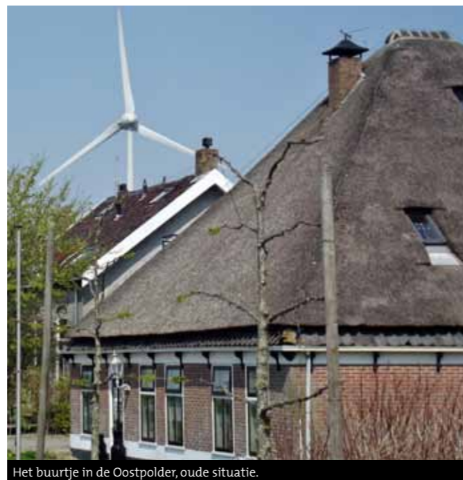
Het buurtje in de Oostpolder, oude situatie.

"Met veel plezier lees ik de Nieuwsbrief, zo ook nr. 83, december 2015, die me triggerde om deze brief te schrijven. Een Nieuwsbrief met een aantal raakvlakken, ik zal aangeven waarom. Ik ben opgegroeid op een stolp in 't Rijpje. Daar zat ik op een kleine lagere school zoals dat in die tijd was...en kwam in die tijd ook met regelmaat in Eenigenburg. Allereerst struikelde ik over het stukje van Dick Visser over