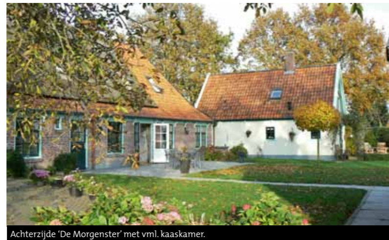
Achterzijde 'De Morgenster' met vml. kaaskamer.