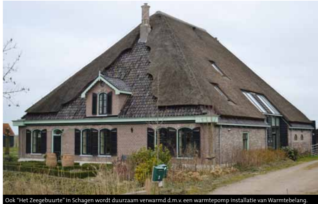
Ook "Het Zeegebuurte" in Schagen wordt duurzaam verwarmd d.m.v. een warmtepomp installatie van Warmtebelang.

Voor het succesvol inzetten van een warmtepomp is een passend totaalplaatje noodzakelijk. Dit houdt in dat per project gekeken moet worden naar mogelijkheden en/of