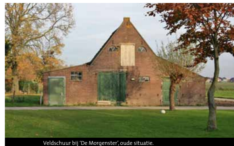
Veldschuur bij 'De Morgenster', oude situatie.

De veldschuur ('paardenboet') die gebouwd naast onze stolp uit de jaren 20 van de vorige eeuw heeft geen monumentale status maar is ook wel weer een exponent van zijn tijd. Hierin werden vroeger de koets met de paarden gestald. De schuur hebben we met vergunning gesloopt en weer in dezelfde vorm en afmetingen opgebouwd. Hierbij is ook het laatste asbest dak van ons terrein verdwenen. Ook dit gebouw is voldoende groot om een woonhuis in te maken. Deze veldschuren zijn bij 8 van de 10 stolpen te vinden, horen bij de stolp, en zijn van een middelgrote omvang. Het is een uitbreiding op de bestaande stolp, dus ook van een recentere datum. Meestal wel passend bij de bebouwing maar geen deel van het monument. Deze schuren zijn meestal groot genoeg voor een kantoor, een praktijkruimte of een atelier. Om deze schuren behorende bij de stolp te behouden moet er een goede invulling aan kunnen worden gegeven. Graag zou ik de mogelijkheid hebben om het te verhuren, maar daar biedt het bestemmingsplan op dit moment geen ruimte voor. Men is politiek wel bewust van de problematiek van het onderhouden en financieren van particuliere (monumentale) stolpen en het te ontwikkelen beleid. Ik ben van mening dat we niet alleen de stolp maar ook de omgeving waardevol moeten onderhouden, exploiteren en beschermen. Als voorbeeld: als een eigenaar zijn oude romneyloods wil slopen om er een karakteristieke kapberg neer te zetten