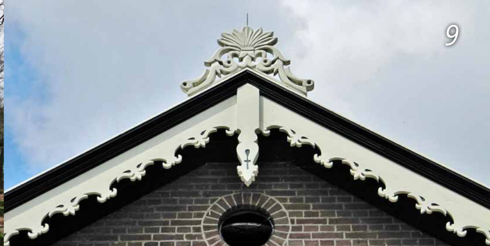
Voorgevel Dorpsweg 51.