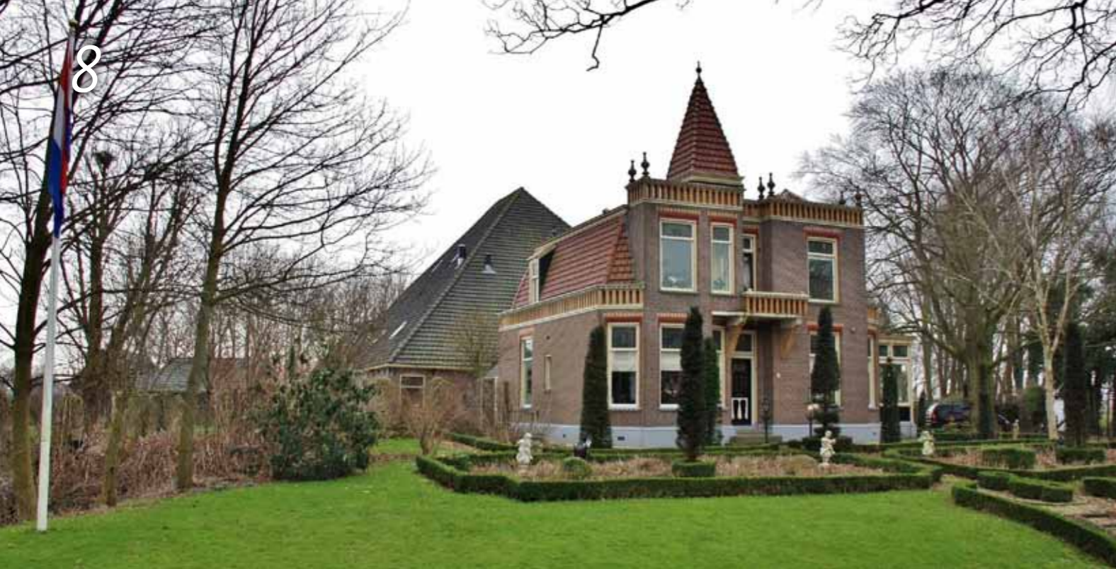
Het Twisker Slot, stolpschuur (van concertzaal tot restaurant) met voorhuis.