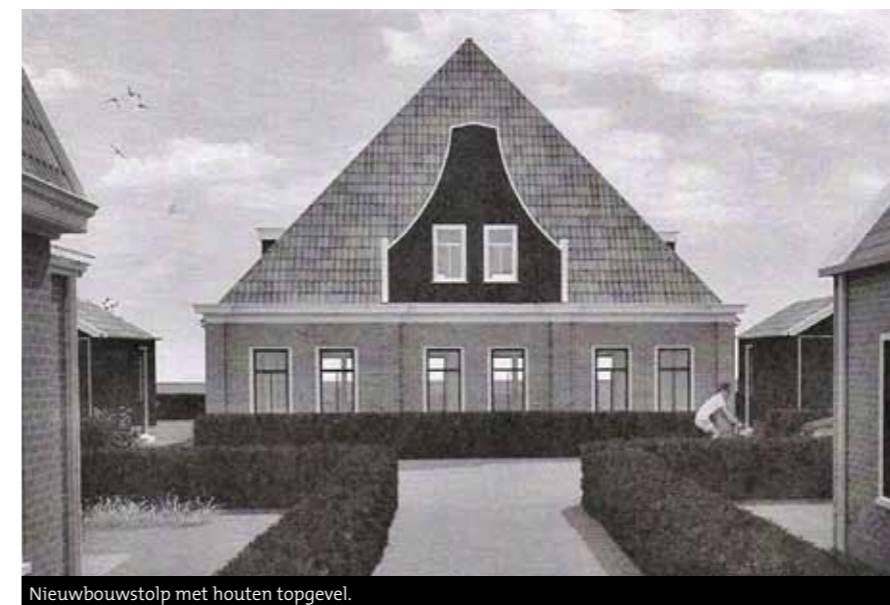
Nieuwbouwstolp met houten topgevel.

De stolp heeft een voorgevel met pilasters. Boven de brede kroonlijst staat een gestileerde houten klokgevel met twee T-ramen. De kapberg is aan de voorzijde uitgebreid met een aanhuiving en aan de achterzijde met een langhuisgedeelte. Een nieuwe stolp en een nieuwe kapberg; het is voortbouwen op de traditie van het oude buurtschap Assum.