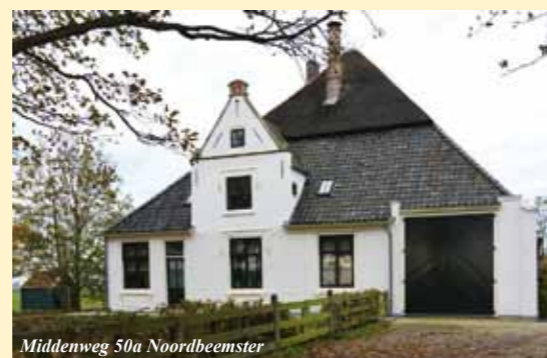
Middenweg 50a Noordbeemster

SCHREPEL 12 DE GOORN - TEL.: 0229 - 540996