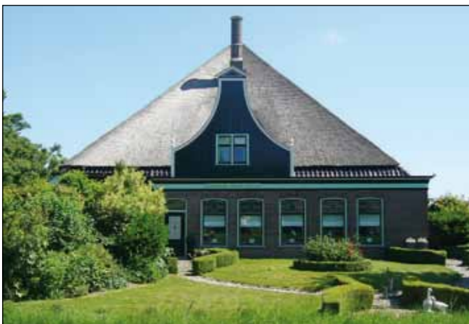
De stolp aan de Ng in Sint Maartensvlotbrug.