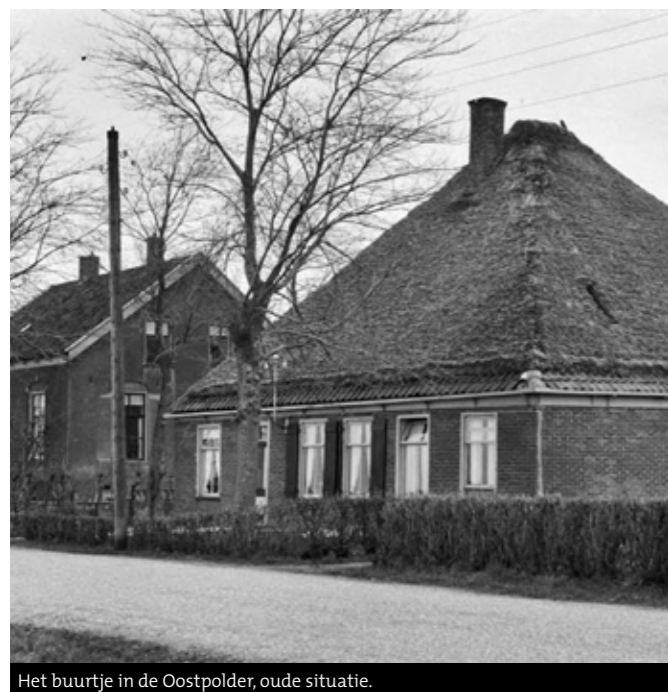
Het buurtje in de Oostpolder, oude situatie.