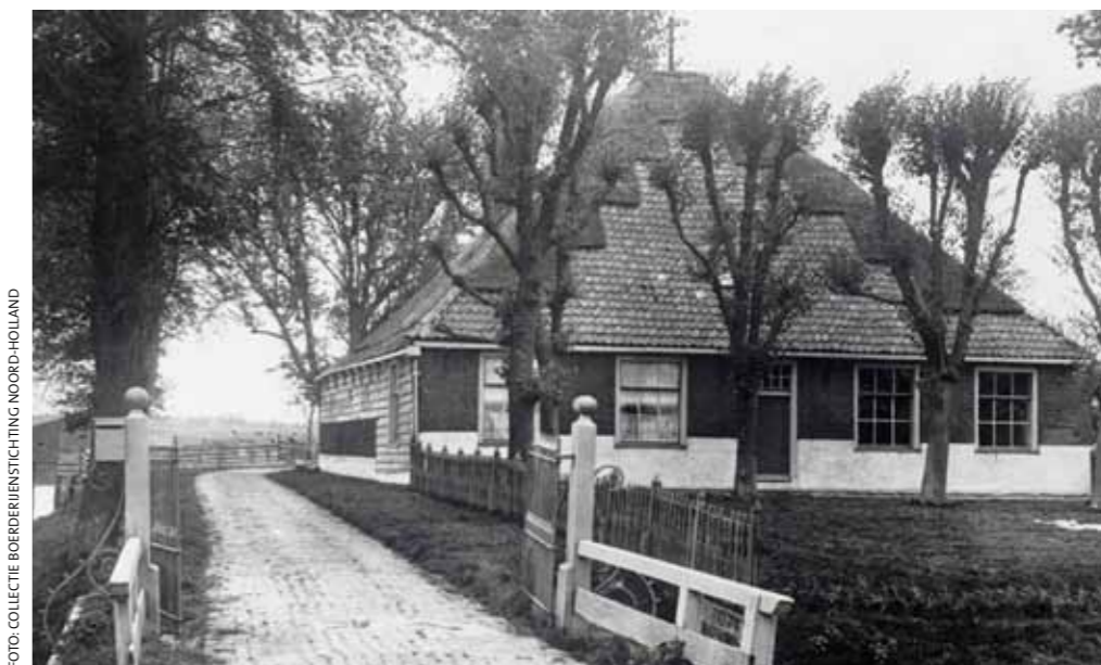
Alle mooie bouwdetails in en bij deze Kiek-stolp. Waar?

Het linker dakvlak is rietgedekt en ondertussen uiterst dun. Tussen de takken schemert een kleine, rechte schoorsteen. Verder is het erf een groot hekkenfeest. De poort met de fiere houten palen waarop links een (wereld)bol en rechts een afgeplatte bol als een Edammer kaasje. Het ijzeren poorthek is recht en draagt witgeschilderde punten ter afweer, zoals ook de krullen achter de hekpalen ongenode toegang moet verhinderen. De brievenbus aan de linkerpaal is een vogelhuisje gelijk en dan dat hek met verticale latten en gepunte palen langs het voorerf: een kleine symfonie. Het erf met vier leilinden is vandaag in gebruik als bleek. Nog een keer de oprit, de laning zo u wilt. Hoe uitnodigend ligt die daar met dat lage houten hek aan de rechterkant. Kom d'r in, lijkt dat de bezoeker toe te zwaaien. En let op: de klinkerbestrating verschiet van verband en klinker vlak voor de poort. Eerst halfsteens en daarna liggen groter formaat (gele?) klinkers in rijen naast elkaar. Ten slotte dat rustieke huisje boven de sloot. De plee op palen. De foto is dus ruim voor de komst van riolering en wc op het plateland. Dat is zeker. Onze vraag is deze keer tweeledig: wie o wie maakt zo'n dot van een laag houten nog eens na en twee wie o wie weet waar deze stolpboerderij met houten weeg staat? Of - minder leuk- stond? Reacties naar het secretariaat. ■