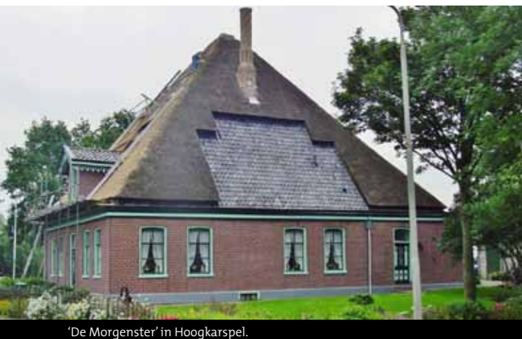
'De Morgenster' in Hoogkarspel.

De stolp is dus qua inhoud gelijk aan zeven woonhuizen (!), voldoende ruimte om te onderhouden en te stoken. Het is een kunst de hele ruimte praktisch te benutten. Bij ons is ongeveer de helft ingevuld. Naast de stolp staat er op het erf ook nog een schuur van betonelementen, karakteristiek voor de jaren 70 en een gevelbeplate schuur uit midden jaren 80 van de vorige eeuw. Elke uitbreiding past bij de tijd waarin het is gebouwd en geeft dus ook de ontwikkeling aan van het boerenbedrijf door de jaren heen. Vandaag de dag staan ook grote loopstallen achter de stolpen waarbij de stolp soms in het niet valt. Toch wordt dit vanwege de ontwikkeling van de landbouw toegestaan en terecht. Stolpen zijn de erfenis van de boerenbedrijven, loopstallen zijn daar de laatste exponent van. De verschillende manieren van stalling zijn dan soms ook economisch achterhaald. Dit moeten we accepteren maar de ruimtes die daardoor ontstaan zijn natuurlijk goed te gebruiken voor andere doelen waarmee er weer een nuttige bestemming ontstaat.