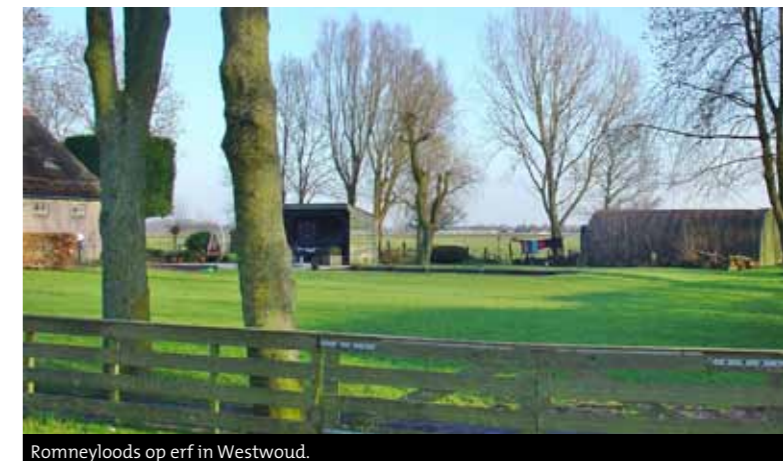
Romneyloods op erf in Westwoud.

moeten we dit aanmoedigen en niet ontmoedigen . Een traditioneel gebouwde kapberg bij een stolp past veel beter dan een romneyloods en is bijvoorbeeld te gebruiken als carport. Daarmee worden auto's aan het zicht onttrokken en blijft het bijgebouw een waardevol onderdeel van het boeren erf.