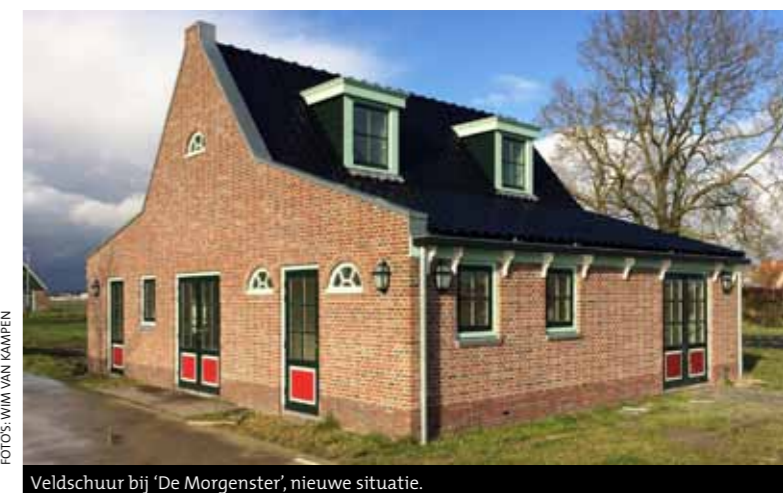
Veldschuur bij 'De Morgenster', nieuwe situatie.