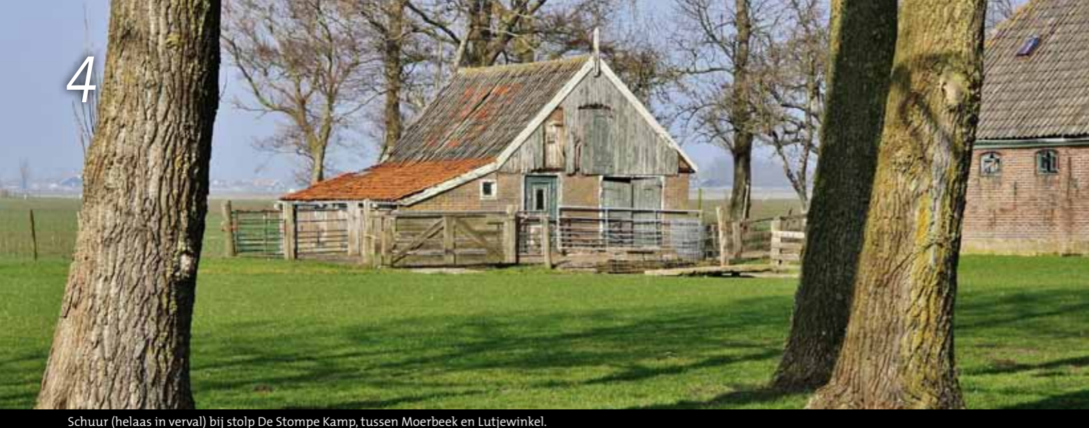
Schuur (helaas in verval) bij stolp De Stompe Kamp, tussen Moerbeek en Lutjewinkel.