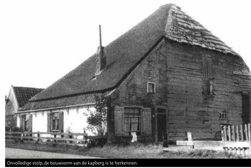
Onvolledige stolp, de bouwvorm van de kapberg is te herkennen.