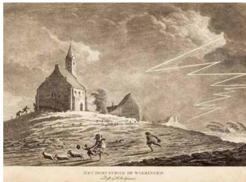
Onweer boven Stroe. Kerk en skuurskot bieden een veilig dak voor mens en vee (1778).

het eiland op. Niettemin zijn de dijken langs de Waddenzee op Delta-hoogte gebracht en staat een volgende dijkversterking op stapel. De aanpak van de Havendijk in Den Oever is daarvan het begin. Nieuwsgierig geworden of - onterecht - bang? Dan dient u dit boeiende boekje ergens te lenen, want het was bij uitgeverij Noord-Holland te Wormer in een klap uitverkocht.