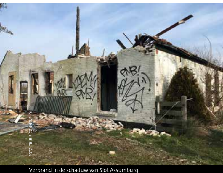
Verbrand in de schaduw van Slot Assumburg.