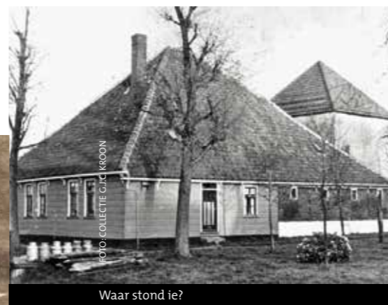
Waar stond ie?