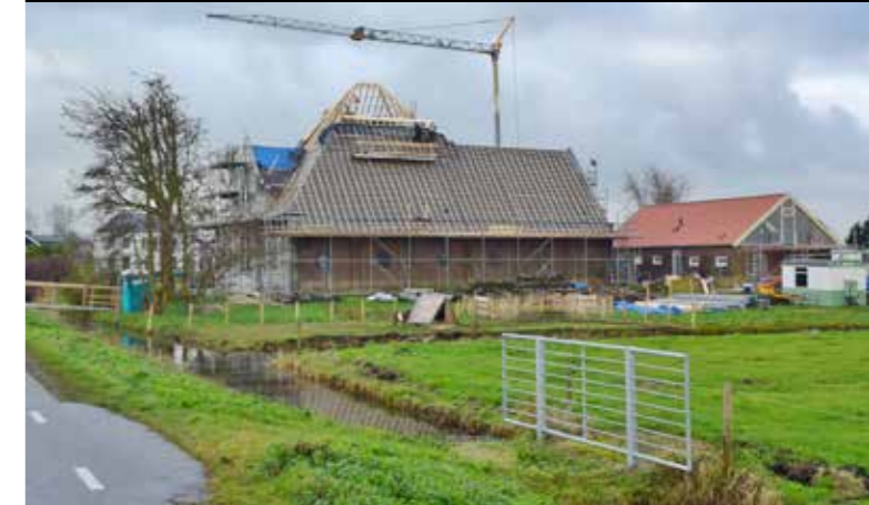
Het boerderijcomplex in nieuwe gedaante.