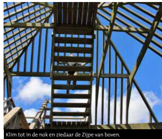
Klim tot in de nok en zie daar de Zijpe van boven.

tenstatus, waarbij gemeenten een rol wordt toebedeeld. De laatste jaren waren die mogelijkheden beperkt omdat er niet meer dan vier aanvragen per jaar konden worden gehonoreerd en de procedure omslachtig was. De hantering van de nieuwe regeling die ook via het Restauratiefonds wordt gerealiseerd, zal dit jaar door de provincie bekend worden gemaakt.