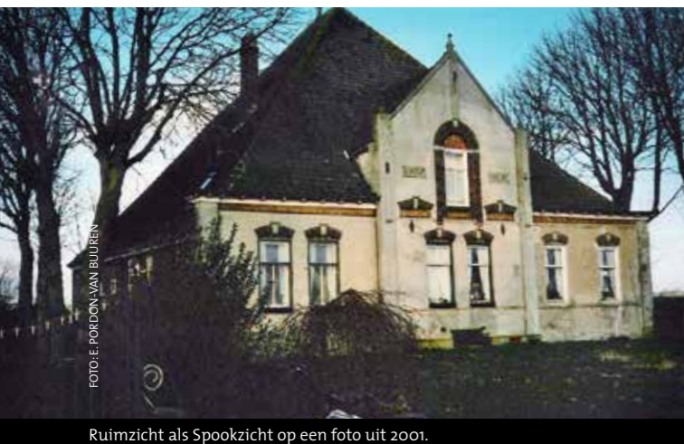
Ruimzicht als Spookzicht op een foto uit 2001.

Ilperveld en Purmerland met slootnamen als Burg- en Veersloot- staat stolpboerderij Ruimzicht. En inderdaad deze stolp rijst op uit het vlakke polderland als een piramide in de woestijn van Egypte. Ruimzicht heeft een majestueus voorkomen met zijn hoge gevels en dito puntdak. Deze koninklijke statuur wordt door de eclectische bouwdetails in de strakke topgevel bevestigd. De enigszins uniform overheersende grijs tinten van muren en dak van betonnen dakpannen lijken de grootsheid van Ruimzicht alleen maar te benadrukken. Dit komt mede door de afmetingen. Ga maar na: Op een vierkant van 7 bij 7½ meter haalt deze stolp een nokhoogte van 15 meter en een grondmaat van 19 bij 23 meter. De laatste maat is inclusief staart, waarin ruimte voor een Zuid-Hollandse (!) stal met plaats voor maar liefst 35 koeien. De voorgevel is tot de strak uitgevoerde