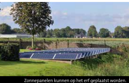
Zonnepanelen kunnen op het erf geplaatst worden.

Wim en Marian Schermer streken neer op het eiland De Woude waar ze op het perceel van een eerder gesloopte stolp een nieuwbouw-woonstolp lieten bouwen. En dat voor een behoorlijke inhoud want de gemeente (Castricum) had op de bewuste locatie voor nieuwbouw wederom een stolp met eenzelfde maatvoering en inhoud (14,50 m 2 bij 14,50 m 2 , incl. garage 1.300 m 3 ) als eis gesteld. Duurzaamheid vormde voor de Schermers het uitgangspunt... Zoals een