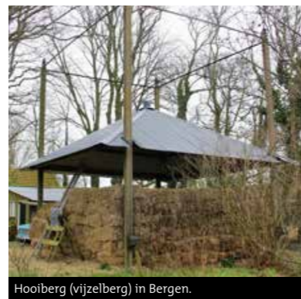
Hooiberg (vijzelberg) in Bergen.

De Rijksdienst Cultureel Erfgoed heeft een brochure over hooibergen uitgebracht. Hoe de bestaande hooibergen het beste te onderhouden, nieuwe functies voor de hooiberg en aspecten bij de bouw van nieuwe hooibergen zijn de beschreven onderwerpen. Op te vragen via de website www.cultureelerfgoed.nl .