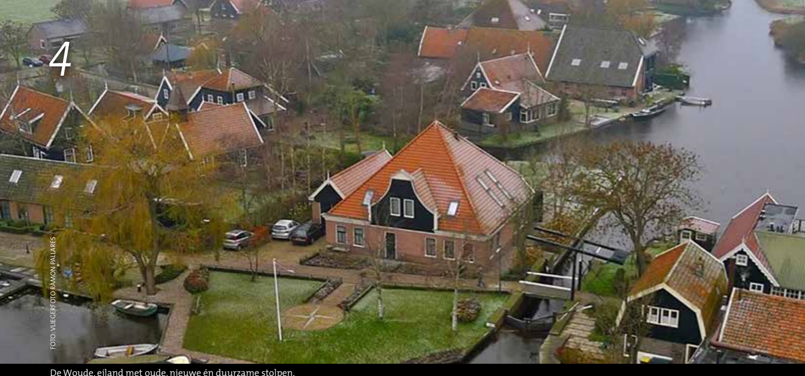
De Woude, eiland met oude, nieuwe én duurzame stolpen.