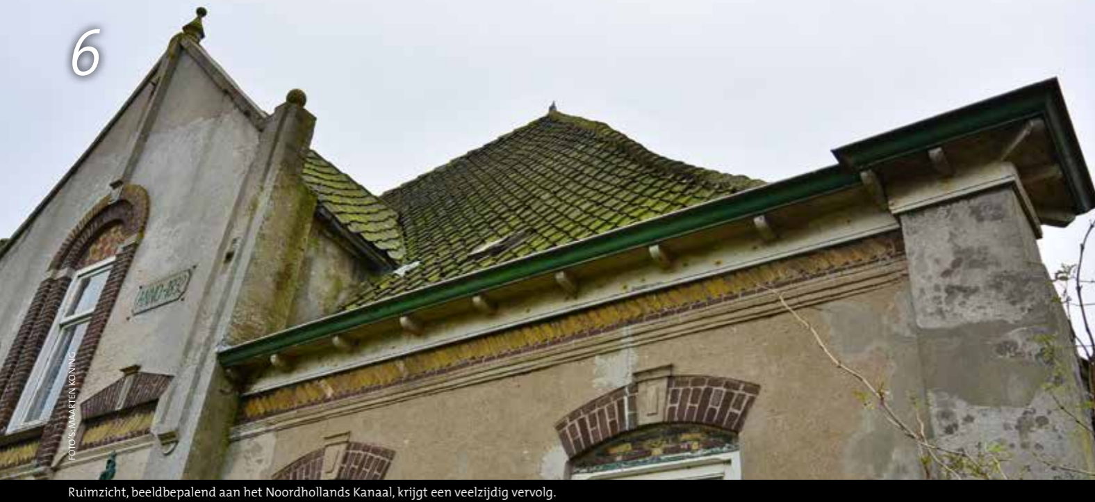
Ruimzicht, beeldbepalend aan het Noordhollands Kanaal, krijgt een veelzijdig vervolg.