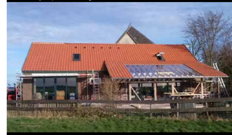
Linkerzijgevel van de meerjarenwoning.