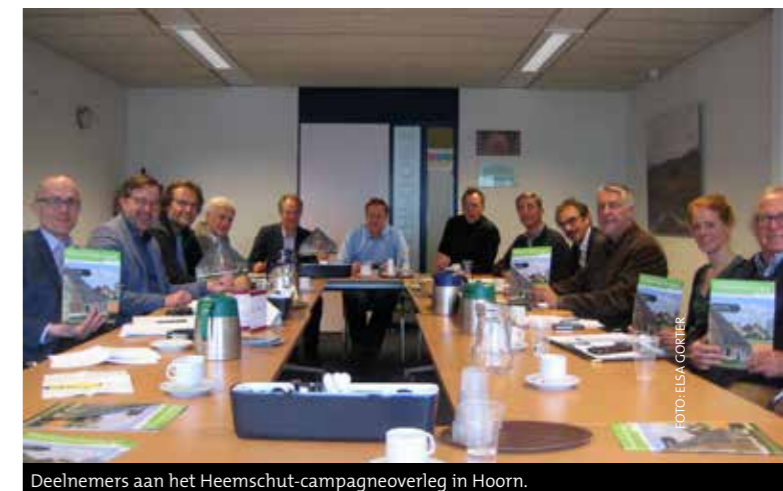
Deelnemers aan het Heemschut-campagneoverleg in Hoorn.