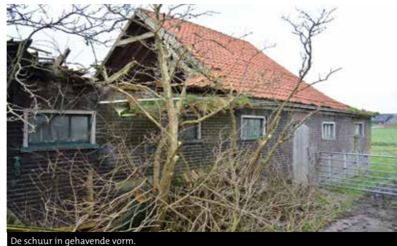
De schuur in gehavende vorm.

bakgoot 5 meter hoog, de zijgevels 4 en de top van de topgevel meet 11 meter. De hoeken van de voorgevel en die van de topgevel zijn voorzien van aanzienlijke pilasters. Deze toepassing wordt in de zijgevels voortgezet, in de noordelijke zijmuur 7 in de zuidelijke 5. Allemaal elementen die bijdragen aan het bijzondere karakter van deze stolpboerderij.