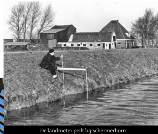
De landmeter peilt bij Schermerhorn.