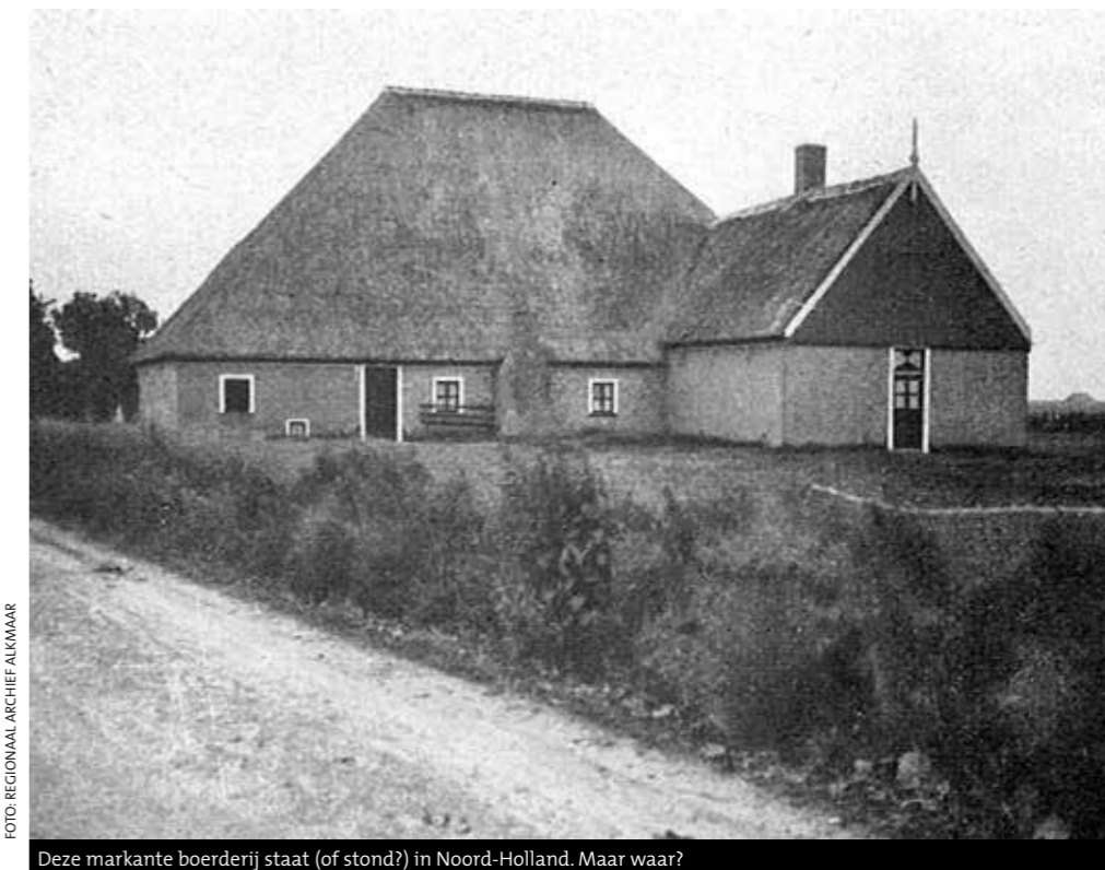
Deze markante boerderij staat (of stond?) in Noord-Holland. Maar waar?