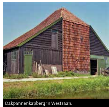
Dakpannenkapberg in Westzaan.

boeren erf. De kapberg was onderdeel van het 'hooihuistype', aangebouwd aan stal en woonhuis of stond solitair in de nabijheid van de stolp. Werd ook kaakberg of barg genoemd en was de voorloper van de inspannende hooiberging in de langhuisstolp. Kapbergen, nu met vooral een woonfunctie of garage, komen het meest voor in Waterland, de Zaanstreek en Kennemerland, vaak bij vaarboerderijen en vrijwel niet in droogmakerijen. De kapberg is ook een gewilde vorm bij nieuwbouw met woonbestemming of bedrijf. Ook aan de bijzondere dakpankapbergen wordt in de publicatie aandacht besteed: bij deze variant zijn de wanden geheel bedekt met dakpannen. Er resteren er nog zo'n tien, de meeste in de Zaanstreek, onder andere in herbouwworm op de Zaanse Schans. De pannengevels vormen een inspiratiebron voor architectuur in nieuwbouwwijken. Streefdatum van de publicatie is begin 2018. (Zie ook het artikel over kapbergen in Nieuwsbrief nr. 86.)