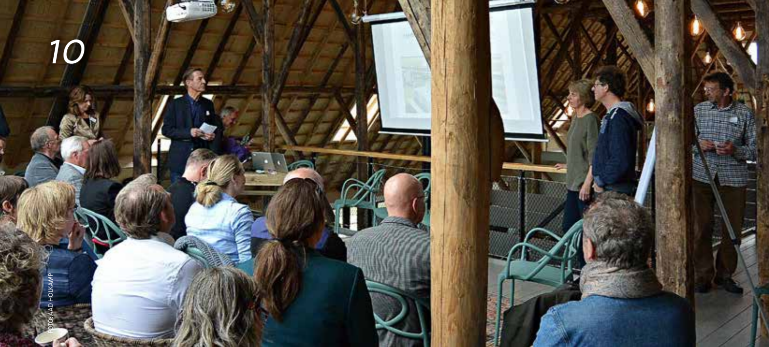
Kennisdeling en discussie over de toekomst van de boerderij bracht vele deskundigen bij elkaar op de expertmeeting in de fraaie Wierschuur op Wieringen.