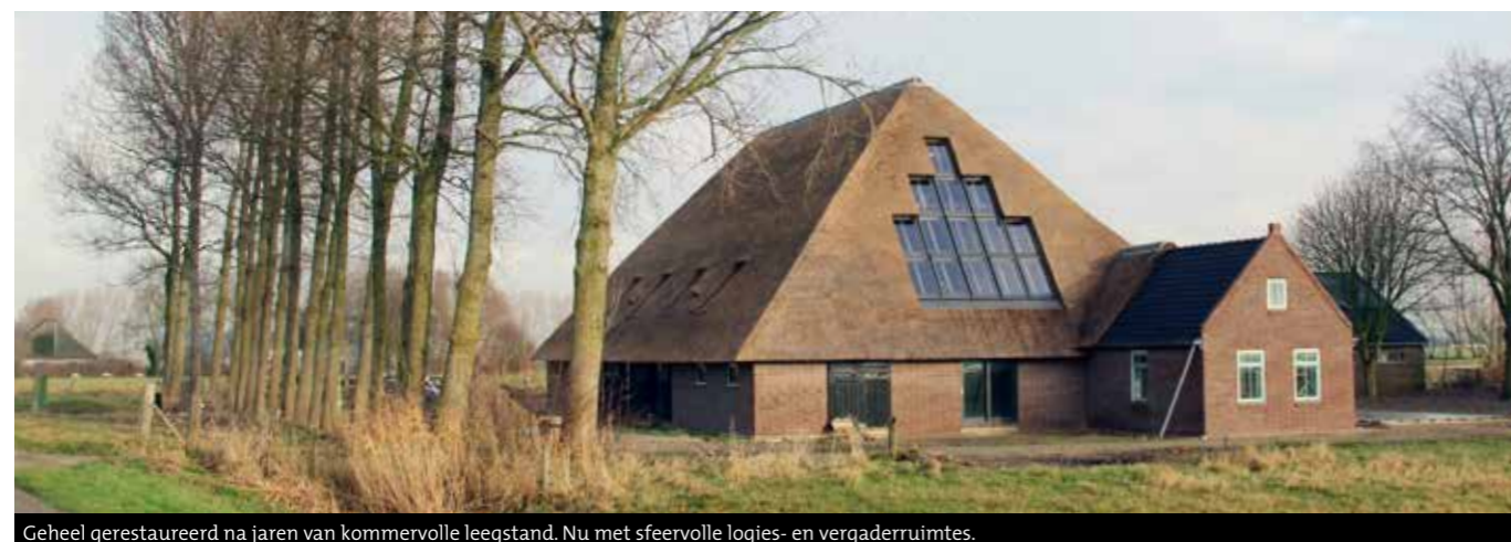
Geheel gerestaureerd na jaren van kommervolle leegstand. Nu met sfeervolle logies- en vergaderruimtes.

Wie de nieuwe stolpeigenaar ook mag zijn, voor iedere nieuwe stolpeigenaar zou de gemeente de rode loper uit moeten leggen en een stolpcoach beschikbaar moeten stellen, die je bij de hand neemt en je door het woud aan regelgeving leidt. We moeten buiten de gebaande paden van de bestemmingsplannen en het gemeentelijke beleid treden. Soepelere wet- en regelgeving van de gemeente, nieuwe bestemmingen en combinaties van bestemmingen mogelijk maken en iets verzinnen om de overheid/ambtenaren bij te spijkeren, zodat zij het ontwikkelen van plannen rond de stolp ook interessant