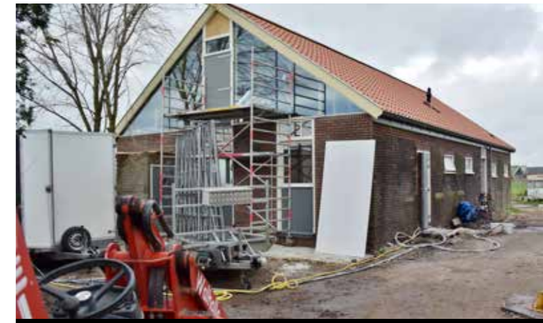
Na restauratie een meerjarenwoning.

Erfgoedvereniging Heemschut is een campagne gestart om de stolpboerderijen in Noord-Holland onder de bekende naam 'Vierkant achter de stolp' in beleid en bekendheid onder de aandacht te brengen. Organisaties die zich met erfgoed en behoud en herbestemming van stolpen bezighouden werden recentelijk voor overleg uitgenodigd zoals de Boerderijenstichting, Mooi Noord-Holland, de gemeente Hoorn en een aantal organisaties in Westfriesland. Heemschut constateert dat bij een aantal gemeenten gericht en doeltreffend beleid voor stolpen ontbreekt en wil met genoemde partners een actie richting politiek opzetten. Belangrijk te meer daar op korte termijn de nieuwe omgevingswet zal worden gehanteerd. Bovendien is een campagne van belang om bij een breed publiek de stolp in 'de etalage' te zetten. ■