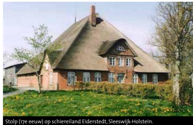
Stolp (17e eeuw) op schiereiland Eiderstedt, Sleeswijk-Holstein.