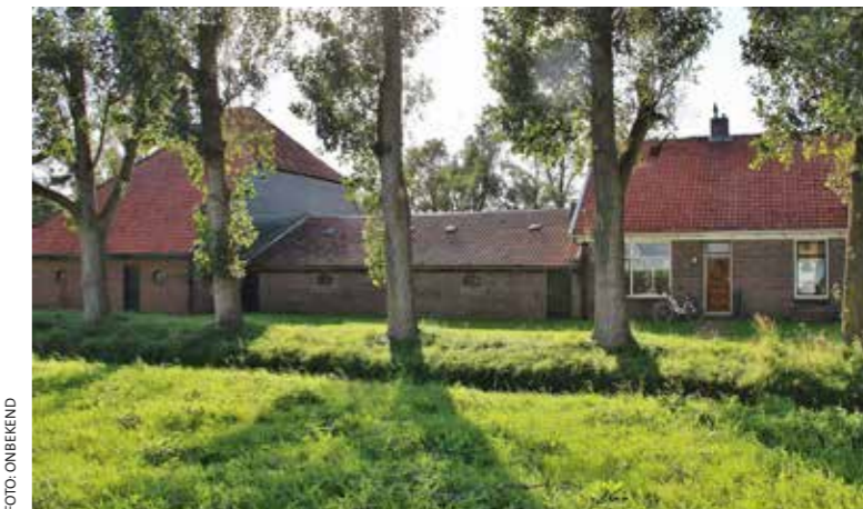
Oostzijde van de gelede boerderij.