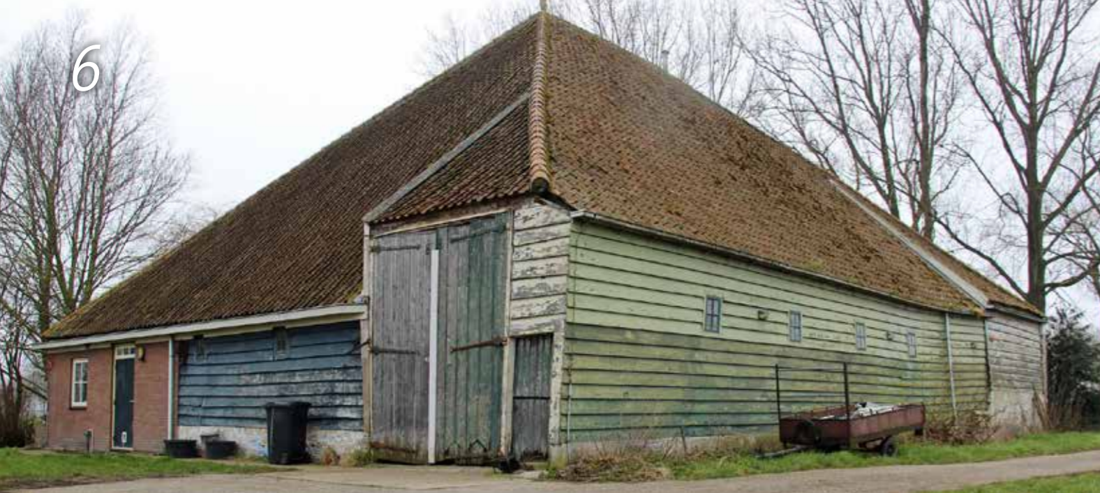
'Schouwzicht'. Sloop dreigt voor deze unieke stolp uit 1722. Nog te redden met een bedrijfsfunctie?