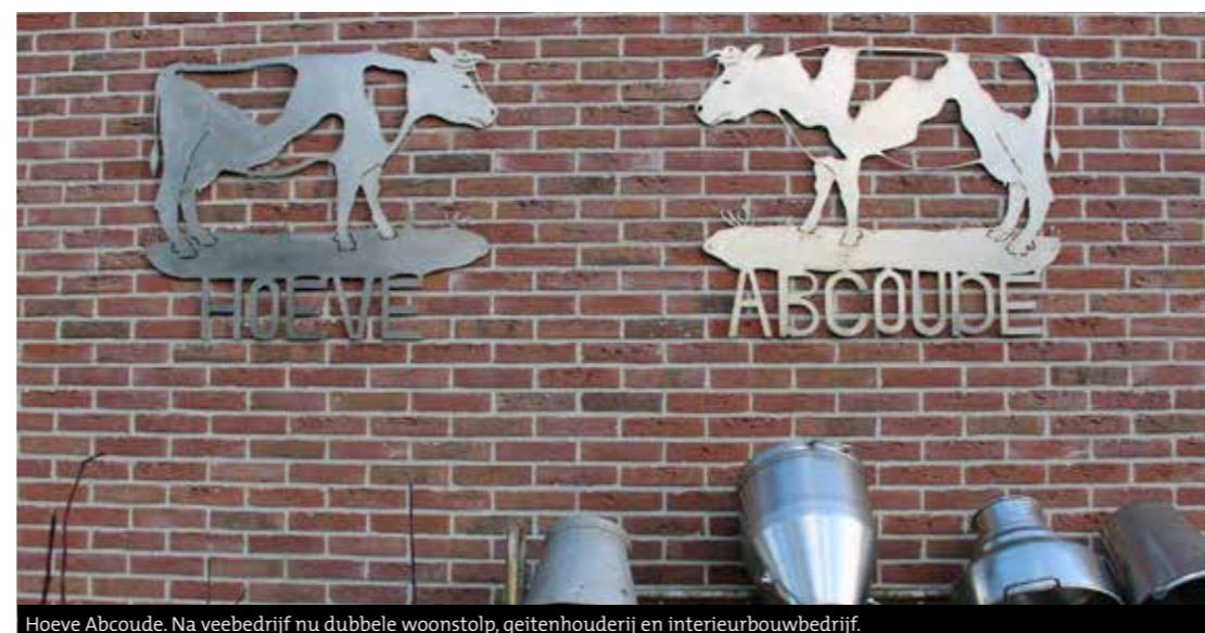
Hoeve Abcoude. Na veebedrijf nu dubbele woonstolp, geitenhouderij en interieurbouwbedrijf.