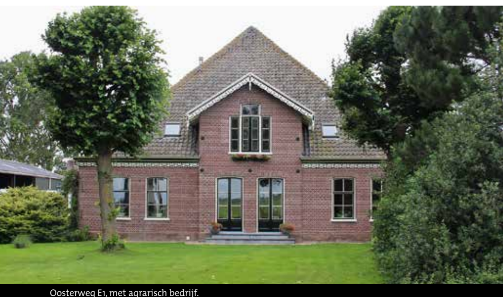
Oosterweg E1, met agrarisch bedrijf.

Deelname (max. 2 personen) is uitsluitend mogelijk door het inzenden van de bon per post of mail. Het maximaal aantal deelnemers is 50, selectie volgt via aanmelding op basis 'wie het eerst komt...' met de verzenddatum van bon of mail als ijkpunt. Niet-eerdere deelnemers krijgen voorrang. Deelname is € 25,- per persoon, incl. koffie, excl. vervoerskosten en lunch. Alle inzenders ontvangen bericht over de mogelijkheid tot deelname. ■