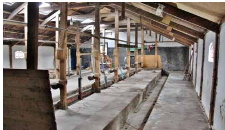
De betonnen dubbelrijige stal uit 1929.