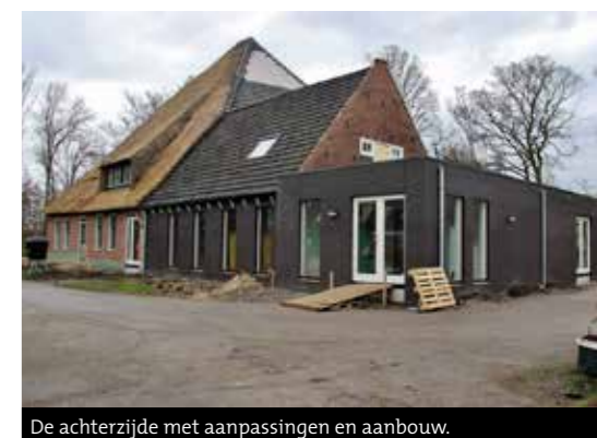
De achterzijde met aanpassingen en aanbouw.