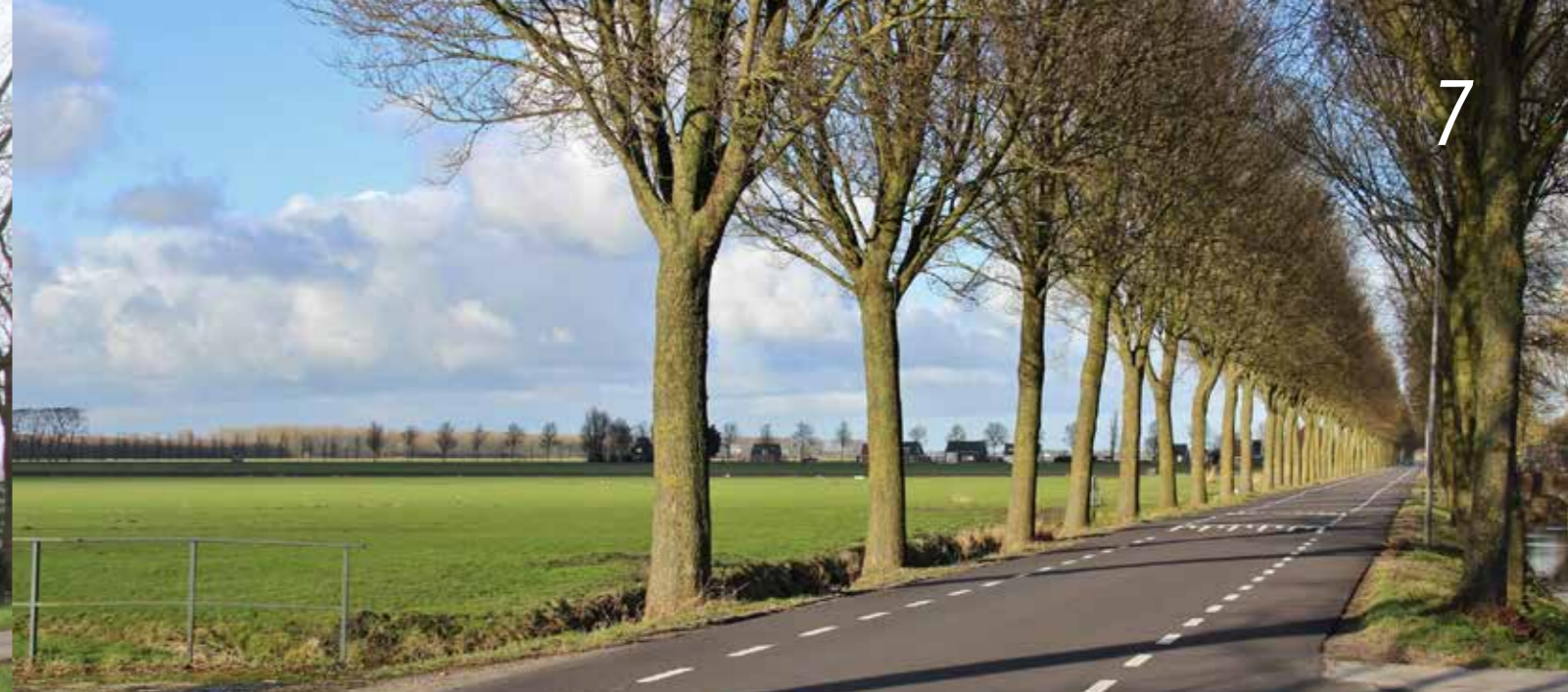
De Oosterweg, kaarsrecht typerend voor de Purmer.