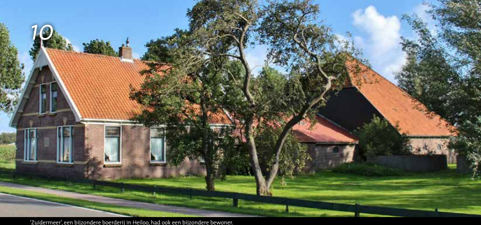
'Zuidermeer', een bijzondere boerderij in Heiloo, had ook een bijzondere bewoner.

De boerderij Kanaalweg 21 van 1924 met stal uit 1929 is een voorbeeld van een 'gelede boerderij'. Een late ontwikkeling in de boerderijbouw die in de eerste helft van de vorige eeuw werd gepropageerd vanwege te verbeteren omstandigheden voor de melkproductie. Bacterievrije melk waardoor de tuberculose-bacil geen kans kreeg zich te ontwikkelen. Dat streven kreeg vorm in een nieuw te bouwen, gelede boerderij met afzonderlijke maar aan elkaar gekoppelde bouwvolumes van woonhuis, stal en (hooi-)opslag. In uiterlijke verschijningsvorm een 20e eeuwse variant van de Noord-Hollandse (Waterlandse) historische hooihuisboerderij. De afgrenzing betekende