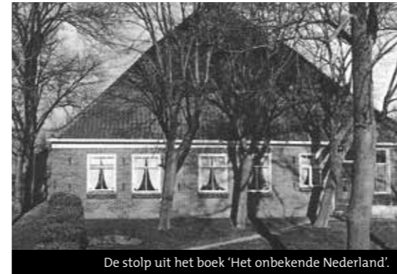
De stolp uit het boek 'Het onbekende Nederland.'