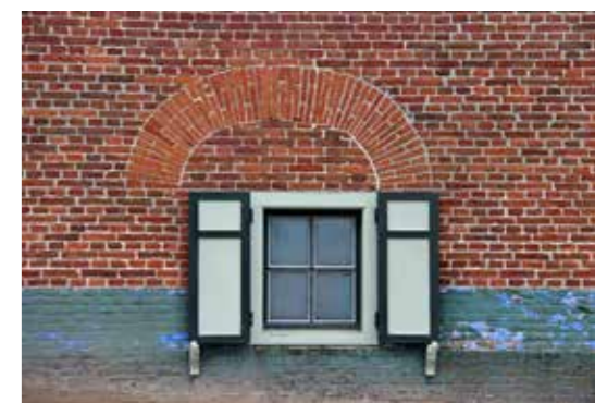
Raam van de kaaskamer.