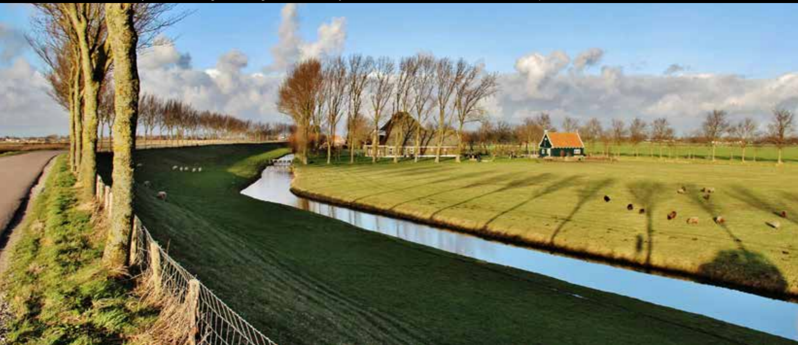
Westbeemster, Westdijk en Wormerweg. Werelderfgoed. Met boerderij 't Woud' van een van onze Vrienden van de stolp .

nieuwe indelingen en aankoop van een stolp. Zijn bezoek duurt zo lang als er aanleiding toe is, tot een dagdeel. Zijn advies is mondeling, niet in de vorm van een uitvoerig rapport. Vorig jaar bracht hij 21 keer een bezoek aan stolpen in de hele provincie. Ook kan hij telefonisch of per mail vele vragen direct beantwoorden. Deskundige advisering zet stolpbewoners op een verantwoord vervolg, enerzijds enthousiasmerend maar ook soms met enige tempering om bouwprojecten qua tijd, energie en financiën in de hand te kunnen houden. Een dergelijk bezoek op locatie met advies is een service voor onze leden voor een tarief van € 125,- all-in, ongeacht de tijdsduur en plaats. Opgave aan het secretariaat: 072-581 68 88 info@boerderijstichting.nl waarna een formulier voor omschrijving van het gevraagde advies wordt toegemailed. ■