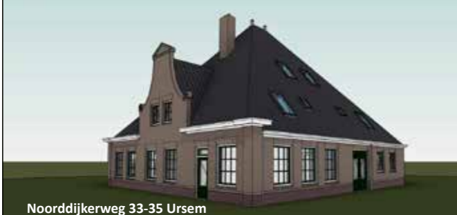
Noorddijkerweg 33-35 Ursem

Aan de Noorddijkerweg nabij Ursem zullen twee traditionele stolpboerderijen worden gebouwd. Twee nostalgische en karakteristieke piramiden van Noord-Holland met de luxe en het comfort van de huidige tijd. Van beide stolpen is de rechterhelft te koop.