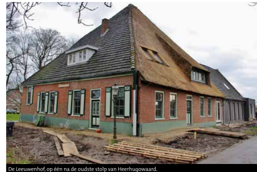
De Leeuwenhof, op één na de oudste stolp van Heerhugowaard.