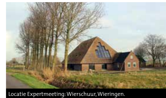
Locatie Expertmeeting: Wierschuur, Wieringen.

Twee woonstolpen en vier 'gewone' woningen in Benningbroek . Dit plan heeft een ondernemer op de plek van zijn verplaatste installatiebedrijf. Sloop bleef uit na de verhuizing in 2012. Nu 'de markt weer goed is', komt het nieuwbouwplan uit de ijskast. Eén stolp is bedoeld voor dubbele bewoning.