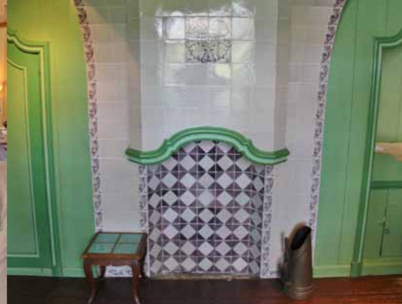
Schouw en bedsteden van de smaakvolle stolp K 154.