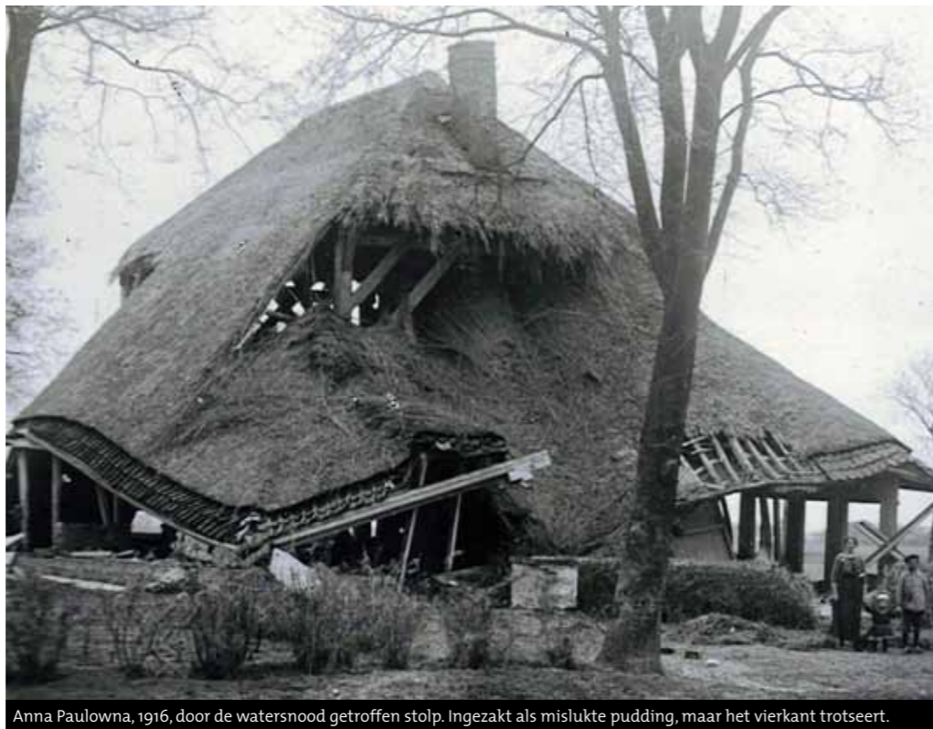
Anna Paulowna, 1916, door de watersnood getroffen stolp. Ingezakt als mislukte pudding, maar het vierkant trotseert.