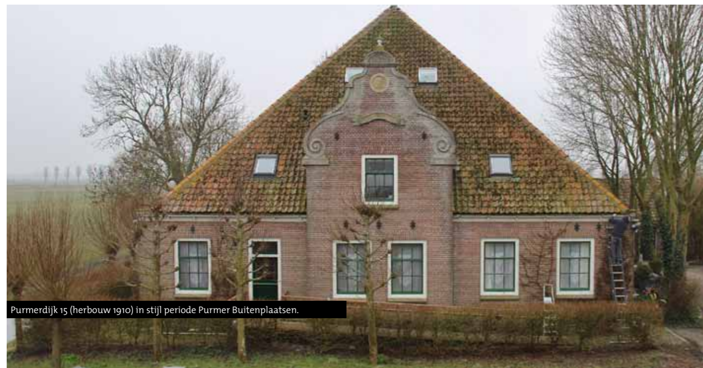
Purmerdijk 15 (herbouw 1910) in stijl periode Purmer Buitenplaatsen.

ISBN 978-90-78381-88-4, NUR 693, € 24,95 (excl. verzendkosten), bestellen@uitgeverijnoordholland.nl