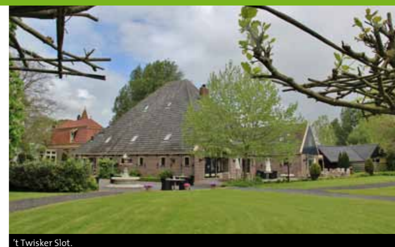
't Twisker Slot.