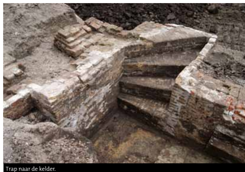
Trap naar de kelder.