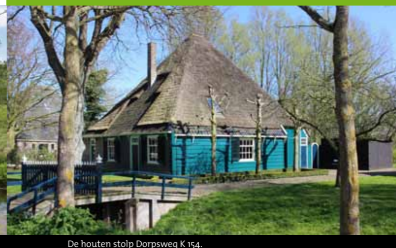
De houten stolp Dorpsweg K 154.