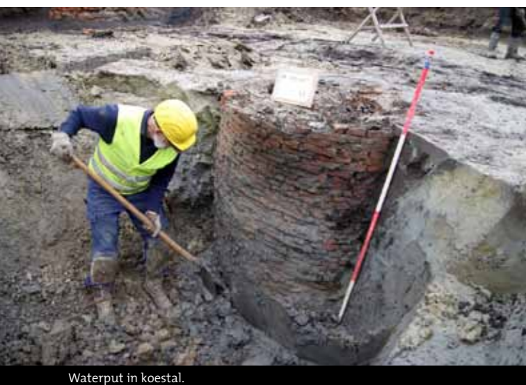
Waterput in koestal.

In de maand mei van dit jaar hebben archeologen de funderingen van een van de grotere voormalige stolpboerderijen in Venhuizen blootgelegd. De boerderij kent een lange geschiedenis. Vermoedelijk werd de eerste stolp hier rond 1600 gebouwd. In de 17 e en 19 e eeuw volgden vele verbouwingen, waarbij onder meer de koestal is vergroot. De boerderij werd eeuwen lang bewoond door de familie Vriend. Een deel van de 18 e eeuwse inventaris van deze kinderrijke familie is in een van de kelders in scherven teruggevonden.