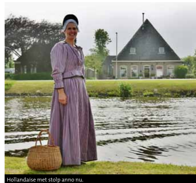
Hollandaise met stolp anno nu.

Pablo Picasso verbleef in 1905 enkele weken in Noord-Holland en bezocht de streek vanuit Schoorl. Hij maakte er twee gouaches en tekeningen in schetsboekjes. Tezamen met documentatiemateriaal en film deze zomer te zien in het Stedelijk Museum Alkmaar.