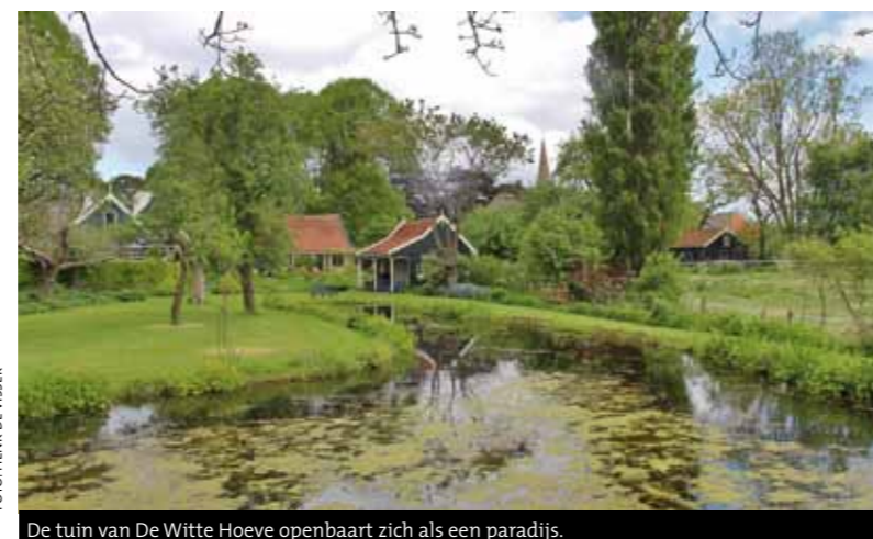
De tuin van De Witte Hoeve openbaart zich als een paradijs.