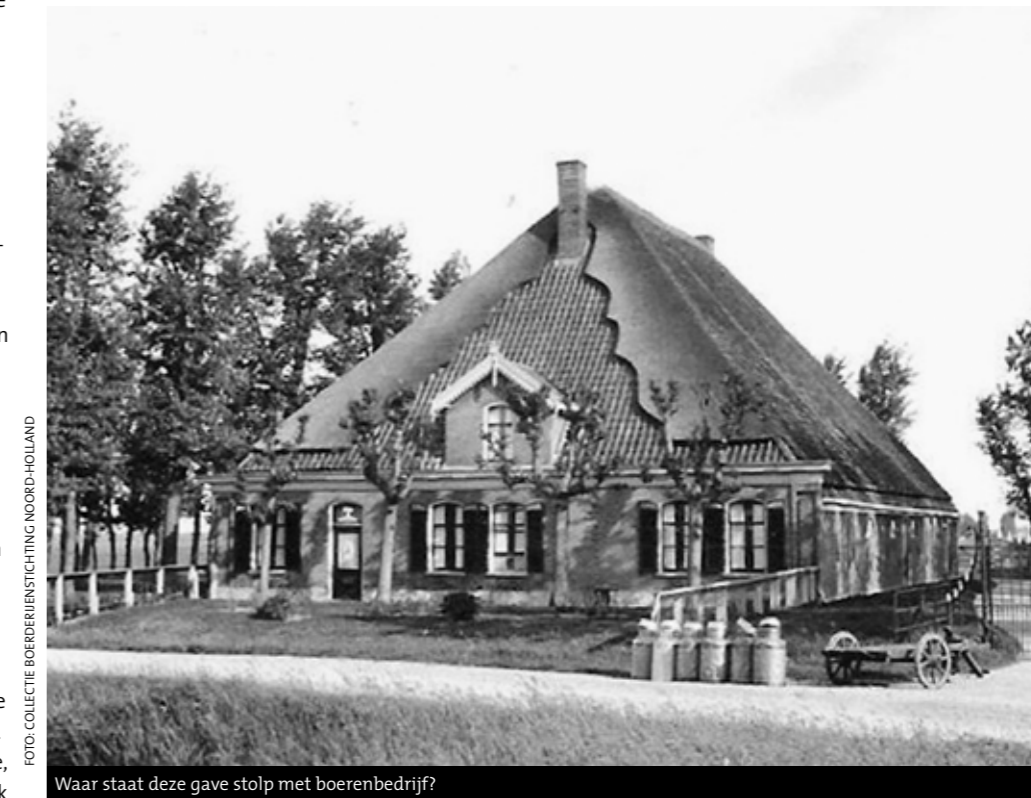
Waar staat deze gave stolp met boerenbedrijf?