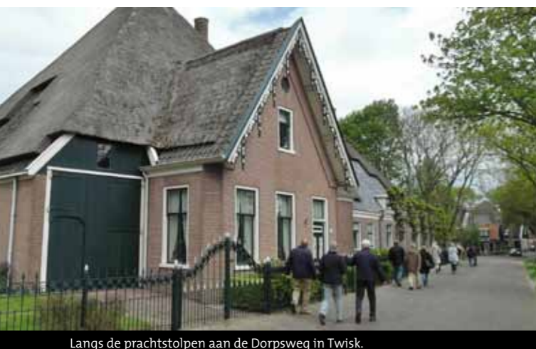
Langs de prachtstolpen aan de Dorpsweg in Twisk.

En laat ik nummer vijf niet vergeten. Een heus slot. Ontvangst en lunch was in de kasteelstolp Twisker Slot. Naast koffie en kroket konden we deze bijzondere stolp bekijken. Voorhuis en stolpschuur vormen een ensemble van de hand van architect Evert Kalverboer en kent een rijke historie. Het was een bijzondere dag. Met veel impressies en volop inspiratie. Ik verheug me op wat de stolpenvrienden zullen brengen bij de najaarsexcursie. ■