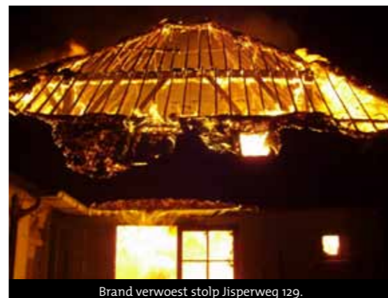
Brand verwoest stolp Jisperweg 129.

Honderd jaar geleden, 1916, werden grote delen van Noord-Holland getroffen door een watersnoodramp. De dijken aan de Zuiderzee in het noorden en in Waterland-Zaanstreek-Wormer braken door en grote gebieden kwamen onder water te staan. Het aantal slachtoffers is beperkt gebleven maar veel vee verdronk, boerderijen werden vernield en de schade was enorm. De ramp was aanleiding voor de ontwikkeling van de Zuiderzeewerken en resulteerde in de aanleg van de Wieringermeer en de Afsluitdijk. In onze volgende Nieuwsbrief ruime aandacht voor de ramp en de gevolgen.