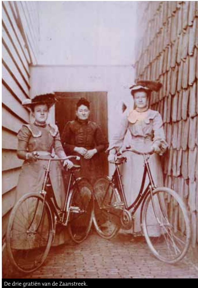
De drie gratiën van de Zaanstreek.