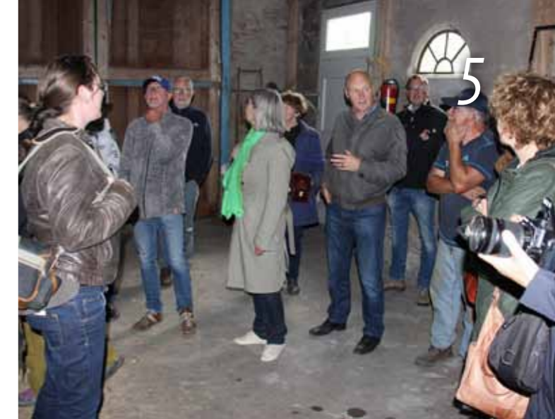
Toelichting op de dars in K 162.