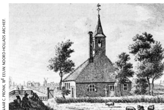
NAAR C. PRONK, 18 de EEUW, NOORD-HOLLANDS ARCHIEF.

(over oude en nieuwe stolpkerken en schuilkerken in stolpen volgt t.z.t. een artikel in deze Nieuwsbrief).