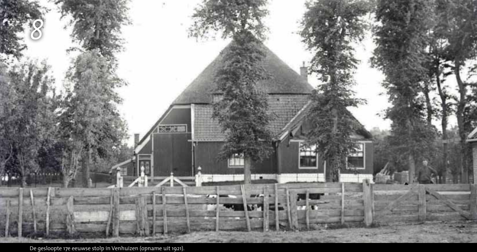
De gesloopte 17e eeuwse stolp in Venhuizen (opname uit 1921).