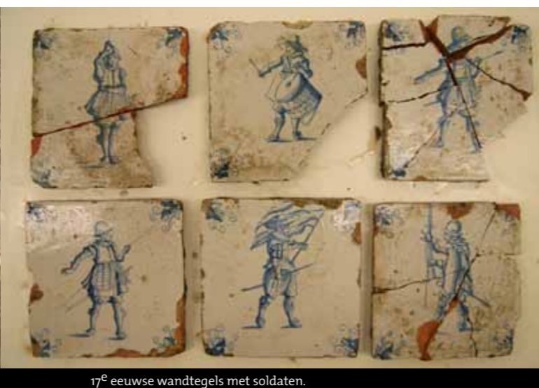
17 e eeuwse wandtegels met soldaten.