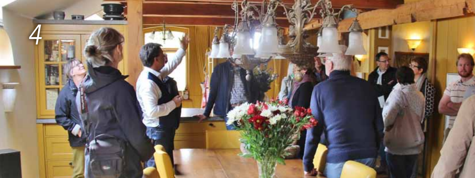
Deelnemers van groep 1 in de stolp van de fam. Colly.