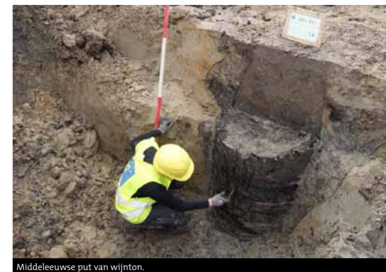
Middeleeuwse put van wijnton.